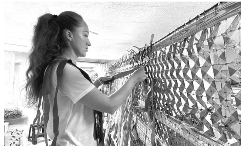
Праздничную дату волонтеры отметили на рабочем месте.