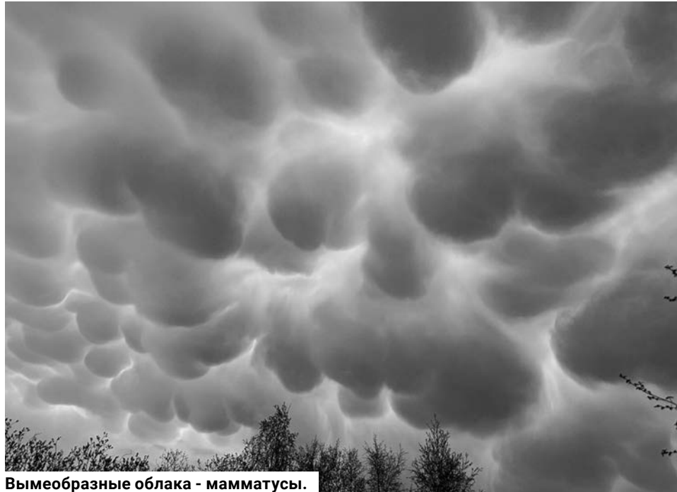
Вымеобразные облака - мамматусы.