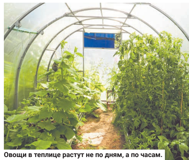
Овощи в теплице растут не по дням, а по часам.