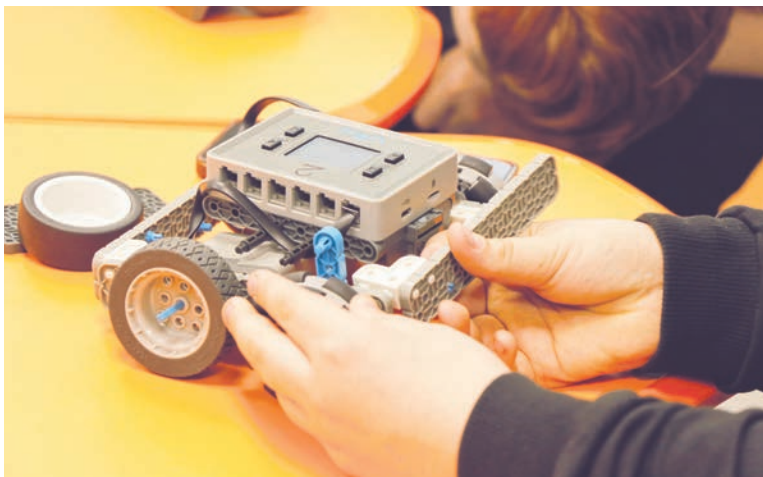
База, на которой ребята могут создавать достаточно большие и прочные конструкции роботов.