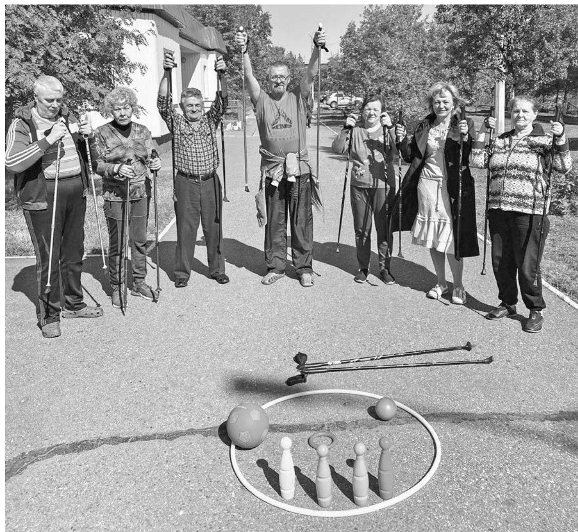
В здоровом теле — здоровый дух! Организации спортивных мероприятий для представителей старшего поколения в КЦСОН уделяют особое внимание.

Проект «Витаминизация», инициированный главой региона Андреем Чибисом в рамках стратегического плана «На Севере — жить», продолжается.