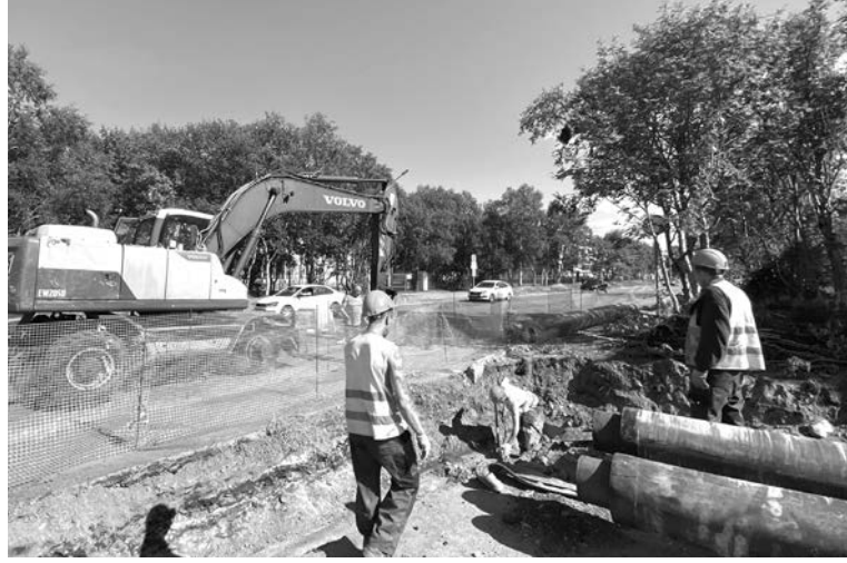
В этом году в Североморске заменят порядка 10 километров тепловых сетей в разных частях города.

По поручению Президента РФ Владимира Путина по итогам рабочей встречи с губернатором Андреем Чибисом в Мурманске в рамках реновации ЗАТО и населённых пунктов с дислокацией военных, на 2024 год региону выделено более 800 млн рублей в том числе на капитальный ремонт основного и вспомогательного оборудования и сетей коммунальной инфраструктуры в Сафоново, Снежногорске, Гаджиево, Полярном и Высоком. Ещё 459,8 млн руб. в 2024 году направлено на ремонт оборудования котельных и 8,65 км сетей теплоснабжения ЗАТО Североморск. На ТЦ-345 и ТЦ-46 в ЗАТО г. Североморск идёт ремонт двух котлоагрегатов. На ТЦ-345 также предусмотрена полная замена запорной и регулирующей арматуры, контрольно-измерительных приборов и автоматики. Помимо этого, за счёт собственных средств АО «МЭС» обновит два водогрейных котла. Новое оборудование позволит не только повысить надёжность теплоснабжения