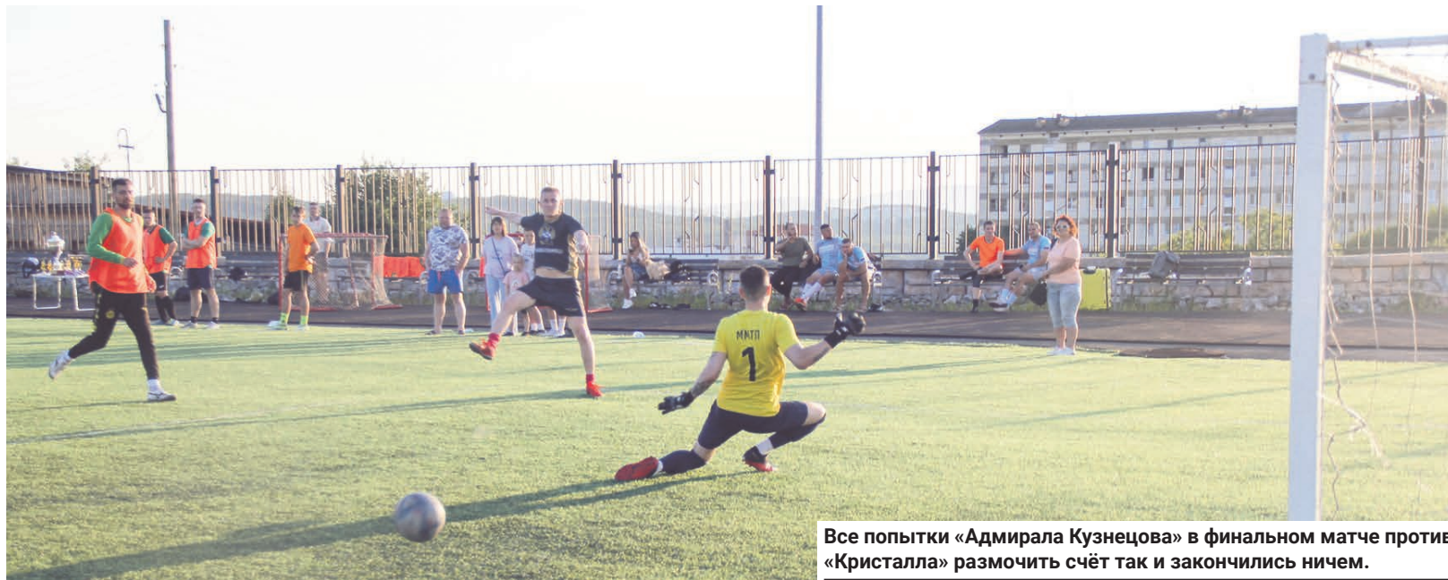
Все попытки «Адмирала Кузнецова» в финальном матче против «Кристалла» размотать счёт так и закончились ничем.

— У нас есть костяк, который из года в год играет, но в целом народа сейчас маловато. Это не оправ-