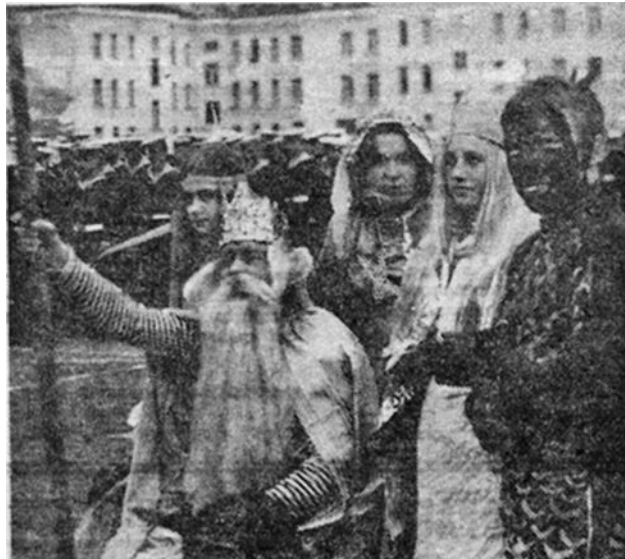
Зрителей приветствует Нептун. 1978 год.