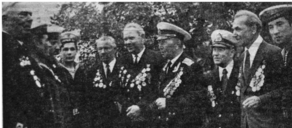
Встреча с ветеранами. 1978 год.

Л. КЛАДЬКО. «СВ» №31 от 30 июля 2004 года.