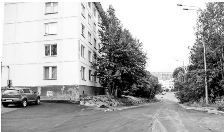
На ул. Сивко заасфальтировали дорогу и увеличили количество парковочных мест.