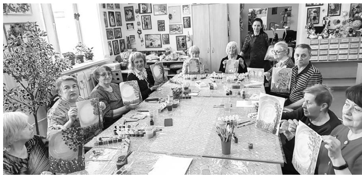
Для получателей социальных услуг в Северноморском Комплексном центре социального обслуживания регулярно проводят творческие мастер-классы.

Андрей ЛИСИЦЫН. Фото из альбома КЦСОН ЗАТО Североморск.