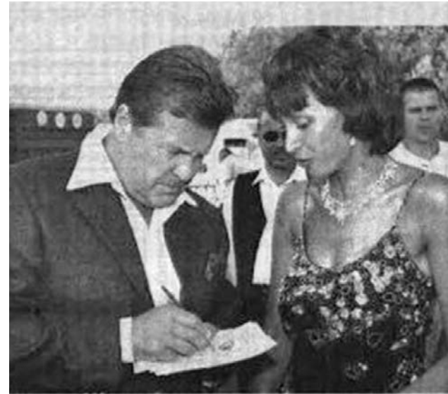
Лев Лещенко раздаёт автографы североморцам. 2004 год.