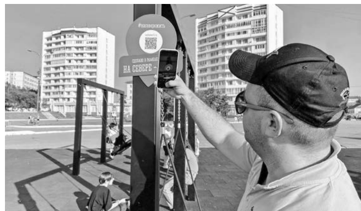
Один переход по QR-коду объекта, обустроенного по плану «На Севере - жить», = 10 баллов.