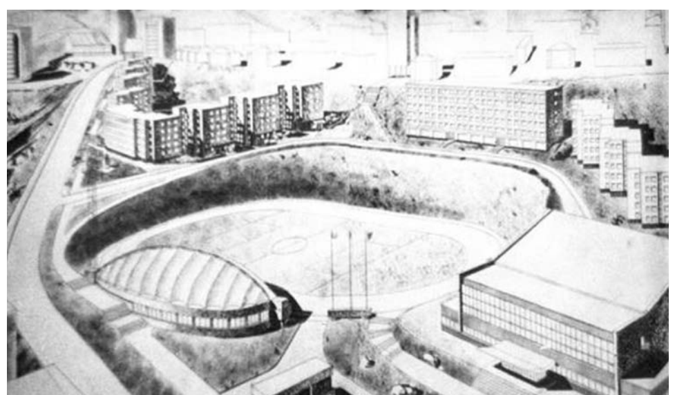
В начале 70-х годов обсуждалась идея перенести центральный стадион в верхнюю часть ул. Душенова, где, по задумке главного архитектора, склоны песчаного карьера стали бы естественными, расположенными амфитеатром вокруг поля трибунами. А с трибун открывался бы прекрасный вид на город и залив.

«Мы (архитекторы Военморпроекта) стремились, чтобы Североморск, столица