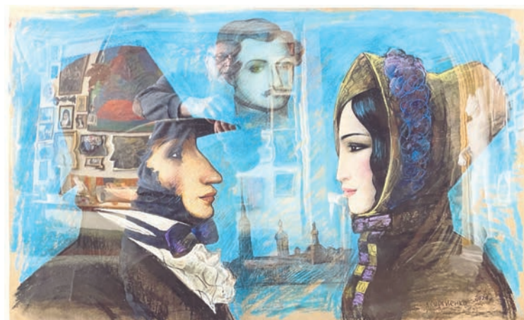
«А. С. Пушкин и Н. Н. Гончарова». Анатолий Сергиенко. 2024 год.