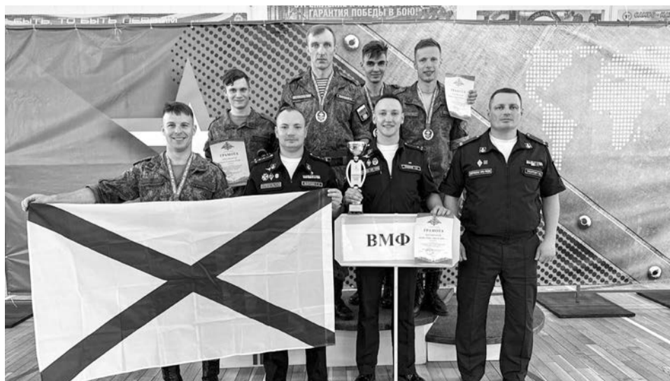
Сборная ВМФ — серебряный призёр первенства Вооружённых сил по военно-прикладному спорту.