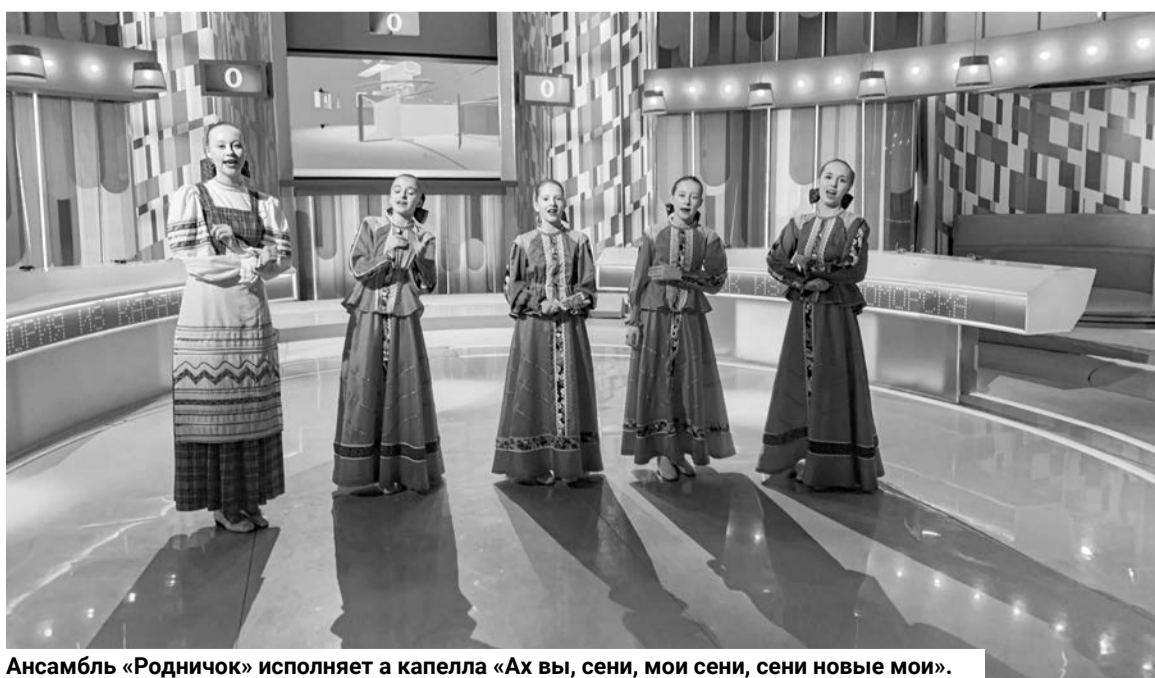
Ансамбль «Родничок» исполняет а капелла «Ах вы, сени, мои сени, сени новые мои».

Игорь ГЛУЦКИЙ. Фото из альбома ансамбля «Родничок».