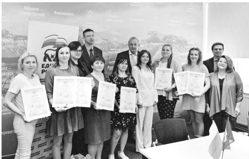
Приятно, что почти половина от общего числа победителей — североморцы.

Сразу четыре представителя североморского детского сада №15 стали победителями всероссийской акции «Крепка семья — сильна Россия». Церемония награждения состоялась на этой неделе в Центре управления регионом.