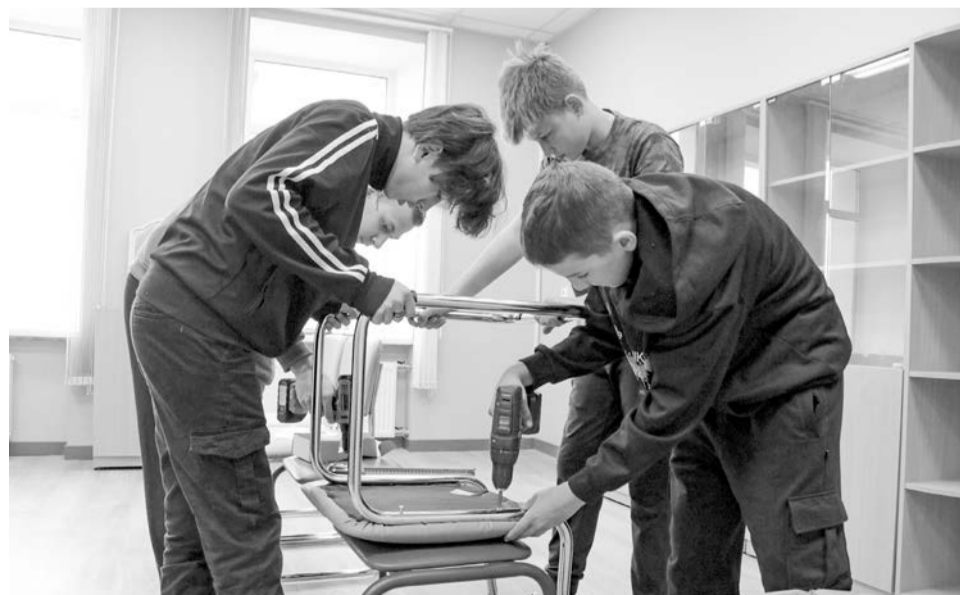
После инструктажа ребята дружно принялись за работу.