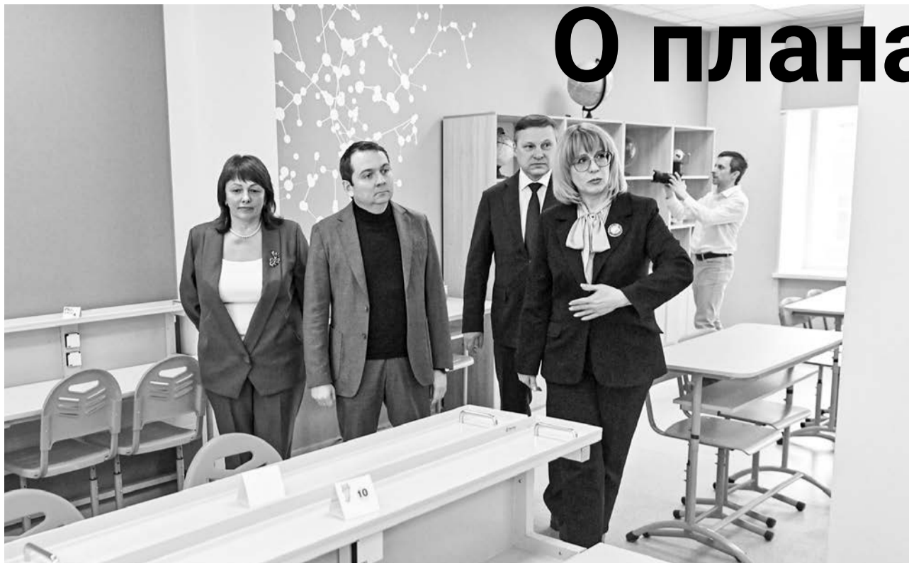
По словам губернатора региона Андрея Чибиса, благодаря капитальному ремонту школа №12 стала современной, удобной для учеников и педагогов.