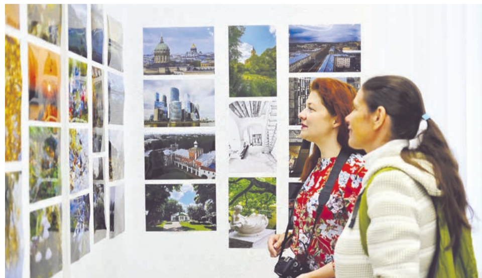
Обе выставки будут украшать зал временных экспозиций Отдела ремёсел до 29 августа.