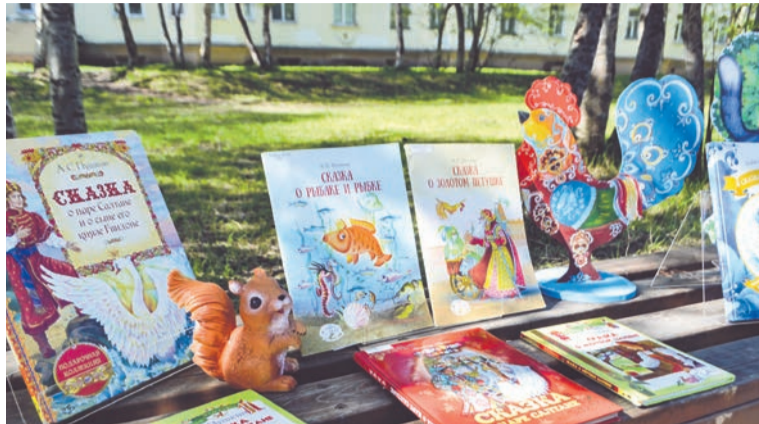
Знакомство с творчеством Александра Сергеевича Пушкина начинается с самого детства.