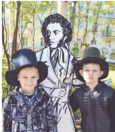
Сменить современные кепки на цилиндры эпохи Пушкина понравилось многим ребятам.