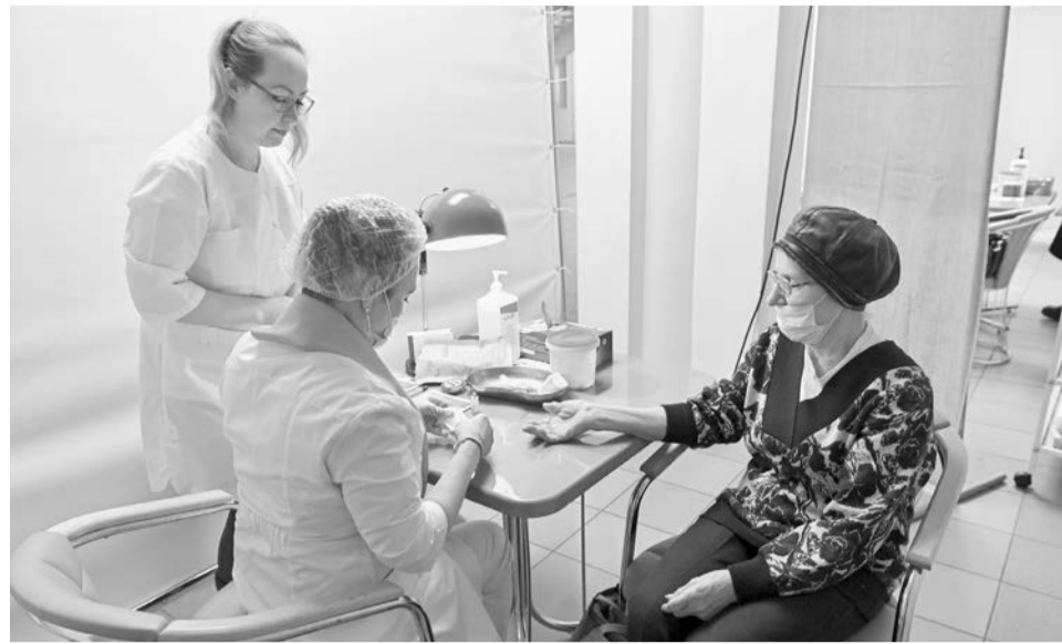
«Витаминация» — один из масштабных проектов стратегического плана «На Севере — жить».

— В рамках стратегического плана «На Севере — жить» реализуется более 20 мер по улучшению кадровой ситуации. Во-первых, это компенсационные выплаты, которые в сумме дают до 3 млн рублей за счёт суммирования региональных и федеральных выплат. На сегодняшний день уже принято 5 земских докторов и 2 земских фельдшера. Всего в текущем году данные выплаты запланированы 18 врачам и 4 фельдшерам на сумму более 32 млн рублей. Во-вторых, это гаранти-