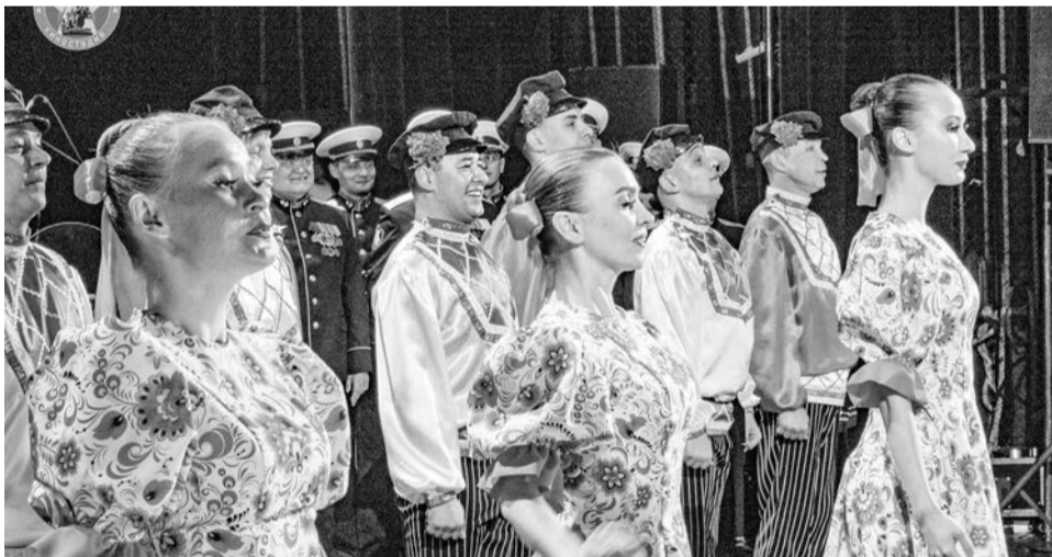
Каждый год Ансамбль песни и пляски СФ — один из главных фаворитов фестиваля.

Ансамбль песни и пляски Северного флота стал лауреатом X Всеармейского фестиваля ансамблей песни и пляски Вооружённых сил Российской Федерации, заняв высшую ступень пьедестала.