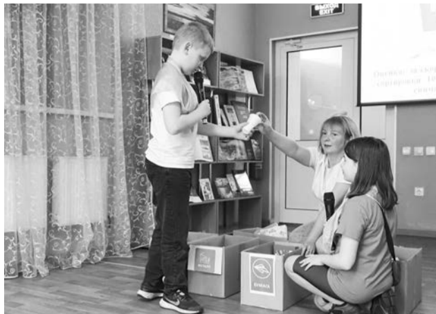
Идёт работа над ошибками на станции «Сортировочной».