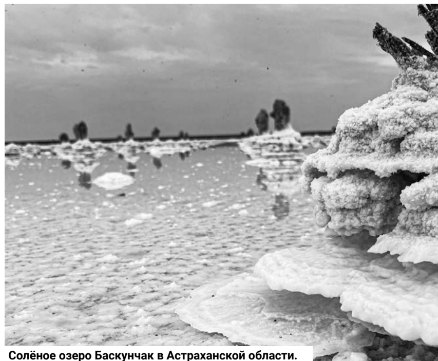
Солёное озеро Баскунчак в Астраханской области.