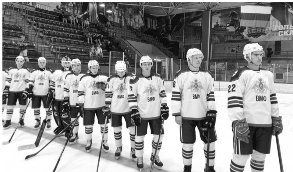
Сборная ВМФ по хоккею — обладатель серебряных медалей Кубка Вооружённых сил - 2024.