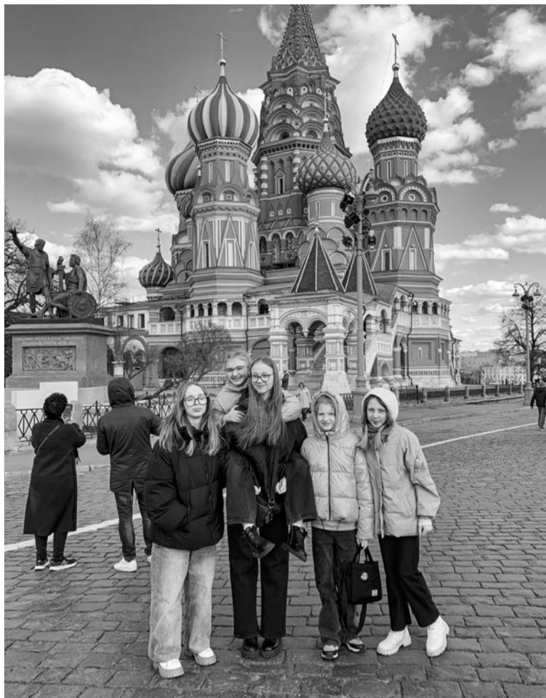
Вокальная северморская пятёрка в Москве у Собора Василия Блаженного.