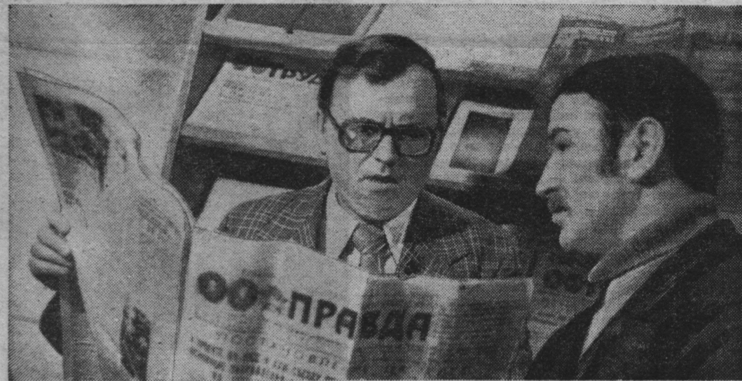
— Помогите разобраться... — подошел к Вещагину бригадир слесарей-сантехников, ударник коммунистического труда, победитель социалистического соревнования 1979 года Нико-

Сейчас в трудовом коллективе широко развернуто обсуждение проекта ЦК КПСС к XXVI партийному съезду. К пропагандисту нередко обращаются рабочие и служащие. Одних интересует положение проекта, касающееся развития отрасли, других — производство товаров народного потребления, а третьи делятся с коммунистом своими соображениями.