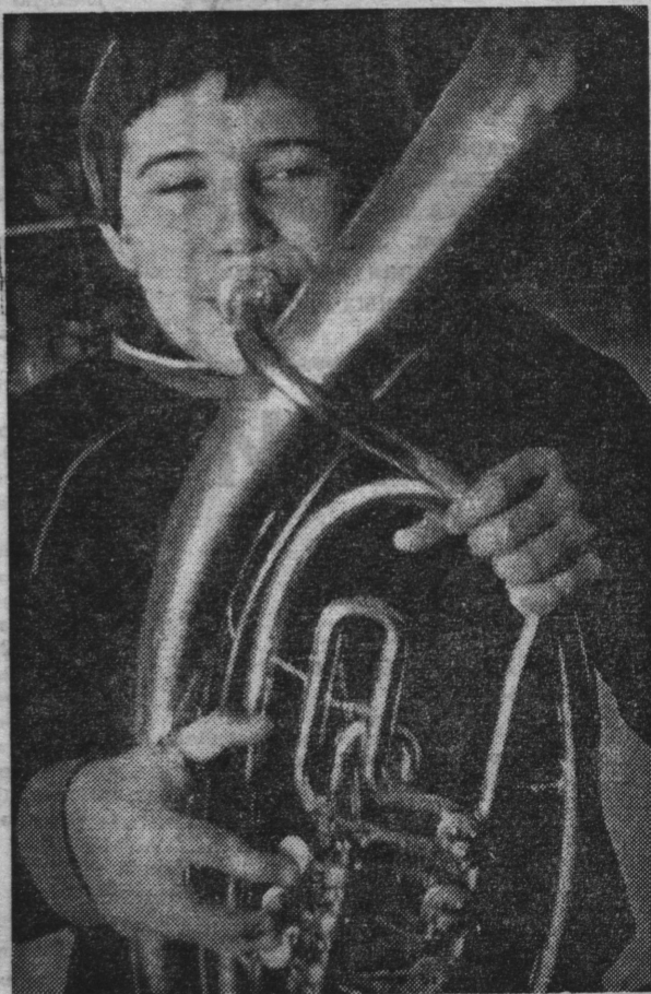
«А я буду трубачом!».