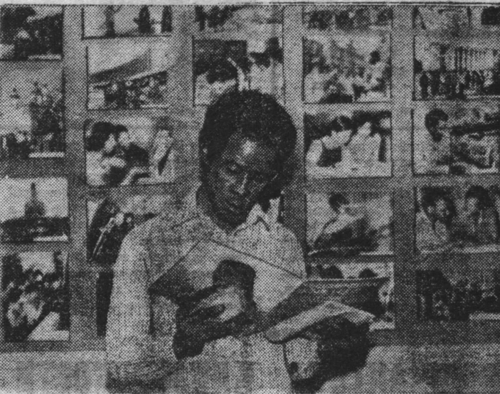
В Республике Мали прошли Дни Советского Союза. НА СНИМКЕ: у фотостенда, развернутого в помещении курсов русского языка в Бамако.