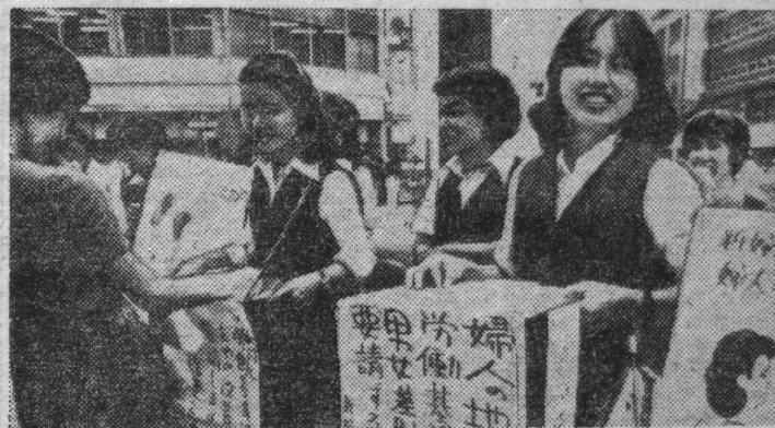
Япония. Несмотря на провозглашенное конституцией страны равенство, японские женщины по-прежнему подвергаются дискриминации.

НА СНИМКЕ: активистки организации «Совет женщин новой Японии» ведут сбор подписей под требованием предоставления полного равноправия.