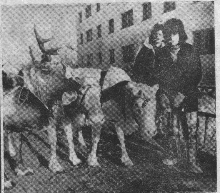
«Там живут оленеводы...».