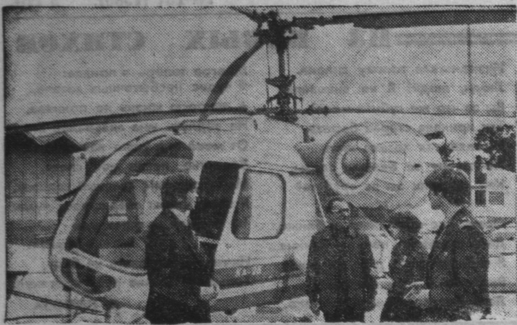
Москва. 450 фирм и организаций из двадцати пяти стран приняли участие во второй международной выставке «Здравоохранение-80». На снимке: в советском разделе выставки. Санитарный вертолет КА-26.