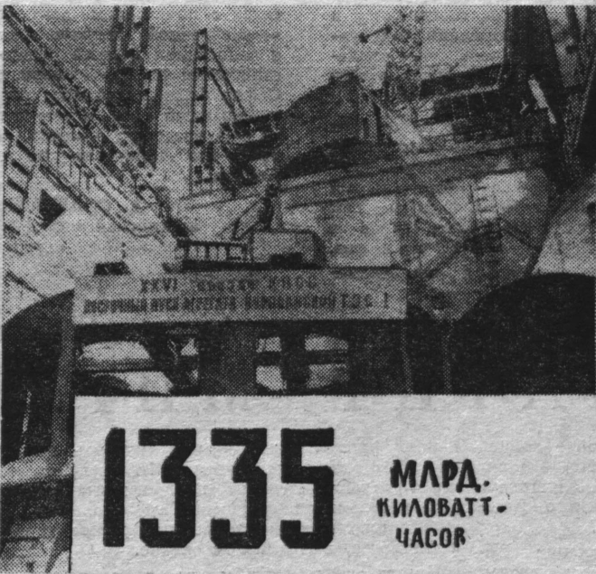
В 1981 ГОДУ БУДЕТ ВЫРАБОТАНО ЭЛЕКТРОЭНЕРГИИ

Энергетики страны, вся армия тружеников отрасли сознают, что они находятся на передовой линии коммунистического строительства.