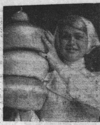
Под урожаем будущего

На этом четвертая сессия Верховного Совета СССР десятого созыва закончила работу.