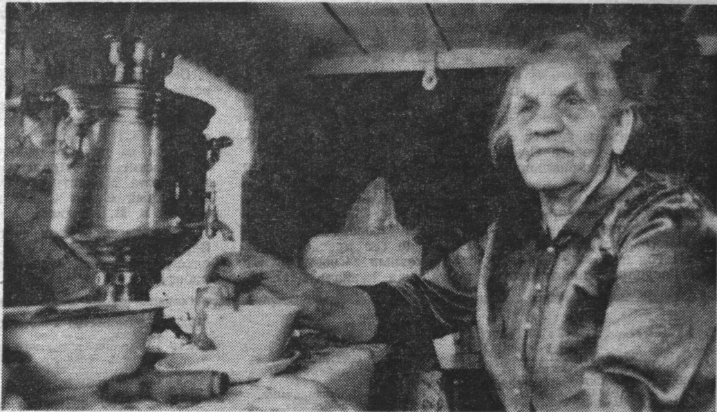
(Окончание. Начало в № 126, 127).