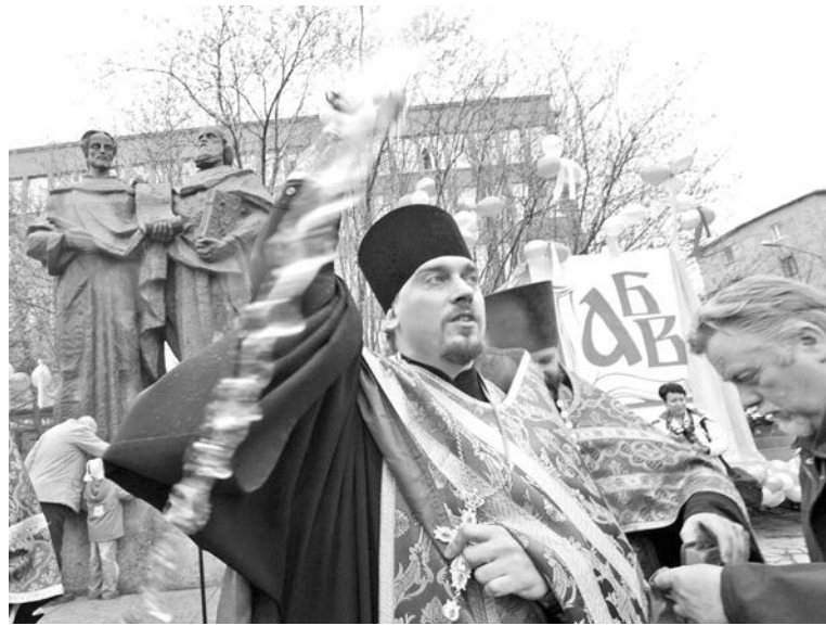
Торжественный молебен - обязательный пункт программы Дня славянской письменности.