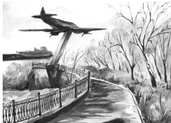
Легендарный ИЛ-4 на площадке Мужества Даниил Красовский увидел в акварели.

Наталья СТОЛЯРОВА.