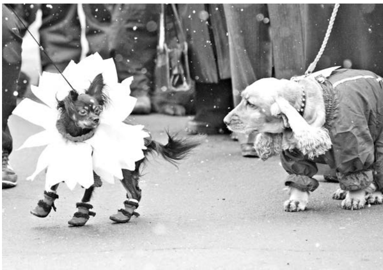
Победители тойтерьер Журналист и кокер-спаниель Мира.