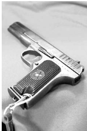
Макет пистолета ТТ образца 1933 года. Год выпуска - 1943-й.

В 1997 году неожиданным образом начала формироваться бонистическая коллекция основного фонда. Конфискат из несколь-