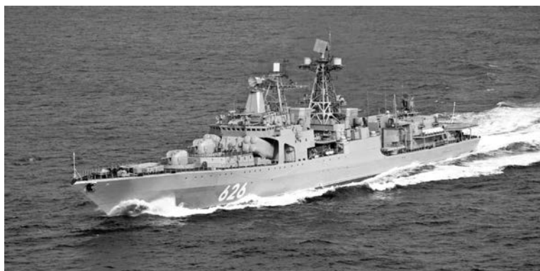
По материалам отдела информационного обеспечения пресс-службы ЗВО по Северному флоту.

время похода он уже оставил за кормой около 6000 морских миль. Во время делового захода корабля в порт Суда (Греция) офицеры экипажа и находящиеся на борту морские пехотинцы получили уникальную возможность посетить многонациональный центр подготовки морских специальных операций. Североморцы обменялись опытом антипиратских действий с иностранными коллегами и провели ряд практических тренировок.