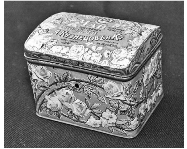
В XIX веке такие металлические чайные коробочки были почти в каждом доме.

Культурная составляющая музейных фондов -