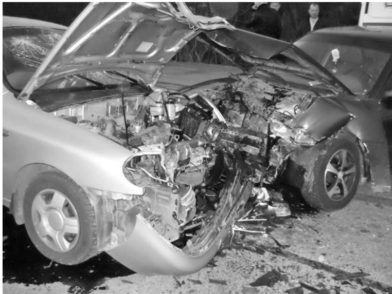
Последствия ДТП 10 мая, когда столкнулись «Шевроле-Ланос» и «Опель-Астра».

Удивительное совпадение, но в тот же день и почти в то же время – около 20.00 – чуть дальше по улице Северная Застава произошло более крупное ДТП. Находившийся за рулем «Форда» гражданин Л. наглядно продемонстрировал окружающим, что такое эффект домино. Неправильно выбрав скорость движения, он врезался в стоящий «Мерседес», который врезался в стоящий «Субару», который врезался в стоящий «Рено». К сча-