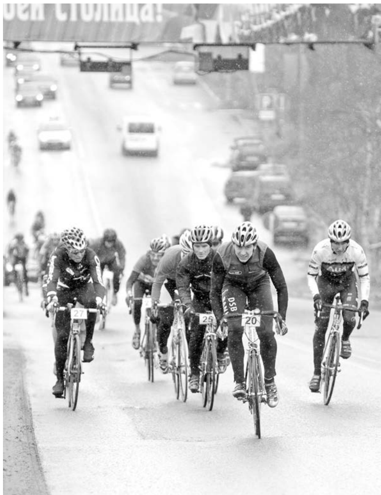
Спортсмены сражались изо всех сил, но плохая погода не позволила им установить новый рекорд трассы.