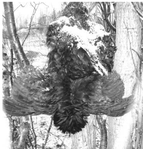
Еще двух обезглавленных петухов охотники видели в районе кладбища возле Североморска-3.

Неожиданной добычей обернулась охота для североморцев Бориса и Алексея: в 3 км от Североморска-3 они обнаружили... петуха.