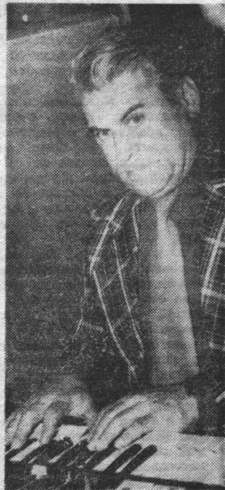
обогатительных предприятий, труженики моря, строители. Думаю, с Севером мы расстаемся ненадолго...

— Впечатления от этой поездки в Заполярье самые хорошие, — говорит Александр Александрович. — Как и два года назад, нас тепло встречали северяне: рабочие горно-