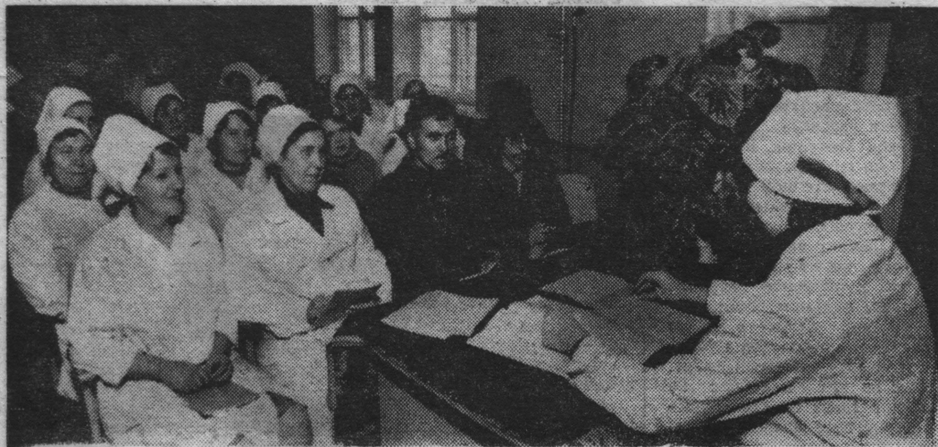
Идут политзанятия на хлебокомбинате г. Североморска.

Каждый выступающий особое место уделял организационной и направляющей роли КПСС в коммунистическом строительстве, авангардной роли коммунистов в решении хозяйственных и воспитательных задач. Умело направляя ход рассуждений, пропагандист подвел слушателей к понима-