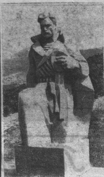
Краснодарский край. Под городом-героем Новороссийском, воздвигнут величественный монумент. Он стал частью Новороссийского мемориального комплекса, который создается в честь подвиги героев гражданской и Великой Отечественной войны.