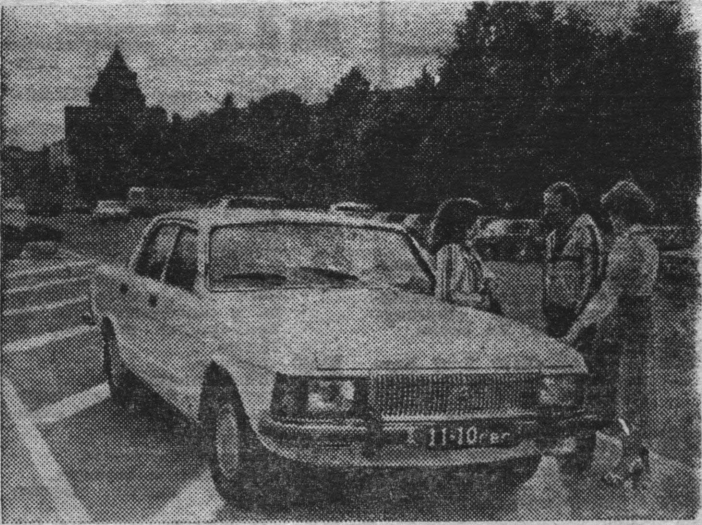
На Горьковском автомобильном заводе закончены приемочные испытания легкового автомобиля «ГАЗ-3102» — «Волга». Новый автомобиль удобнее, долговечнее, эстетичнее старого. У него несколько изменены формы бамперов, фар и фонарей, более совершенными стали пропорции кузова. Сохранив высоту прежней «Волги», конструкторы сделали новую немного длиннее. НА СНИМКЕ: автомобиль «ГАЗ-3102» на улице города.