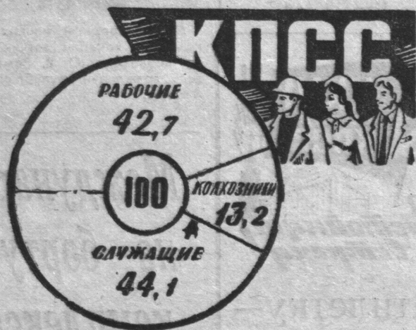
СОЦИАЛЬНЫЙ СОСТАВ ПАРТИИ (в процентах: на 1 января 1979 года)

члены партии, представленные во всех звеньях системы общенародного государства. Например, в числе народных депутатов избрано членов и кандидатов в члены КПСС: в Верховном Совете СССР — 1.075, в Верховных Советах союзных республик — 4.522, в Верховных Советах автономных республик — 2.190, в местных Советах — 979.805. Всего народными депутатами избрано около миллиона коммунистов, или 43,2 процента всех депутатов.