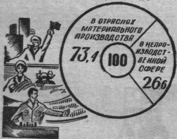
РАСПРЕДЕЛЕНИЕ КОММУНИСТОВ ПО ОТРАСЛЯМ НАРОДНОГО ХОЗЯЙСТВА (в процентах: на 1 января 1979 года)

Огромное дело делают студенческие строительные отряды. В нынешнем году их было организовано более 20 тысяч, бойцами ССО стали почти 800 тысяч молодых людей. За четыре года десятой пятилетки ими сооружено около 57 тысяч разнообразных объектов и выполнено работ почти на 5,7 миллиарда рублей.