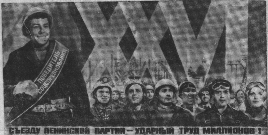
СЪЕЗДУ ЛЕНИНСКОЙ ПАРТИИ — УДАРНЫЙ ТРУД МИЛЛИОНОВ!

Плакат художников В. Корецкого и Д. Пяткина.