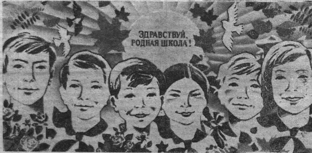
Плакат художника И. Овасапова. Издательство «Плакат».