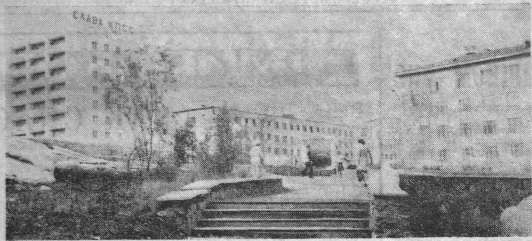
Североморск. Погожий день.