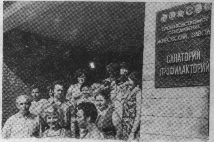
На Ленинградском производственном объединении «Кировский завод» большое внимание уделяется здоровью и отдыху тружеников предприятия.

После рабочей смены принимает отдыхающих заводской санаторий-профилакторий. Новую жизнь получили старинные особняки в поселке Стрельна, где находится пансионат «Красные зори».