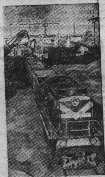
НА СНИМКЕ: отгрузка сверхплановой руды для Лыпецкого металлургического завода.

БЕЛГОРОДСКАЯ область. На ударную вахту в честь XXVI съезда КПСС встали горняки Стойленского горно-обогатительного комбината — передового предприятия Курской магнитной аномалии. Они добыли с начала пятилетки 240 тысяч тонн сверхплановой руды.