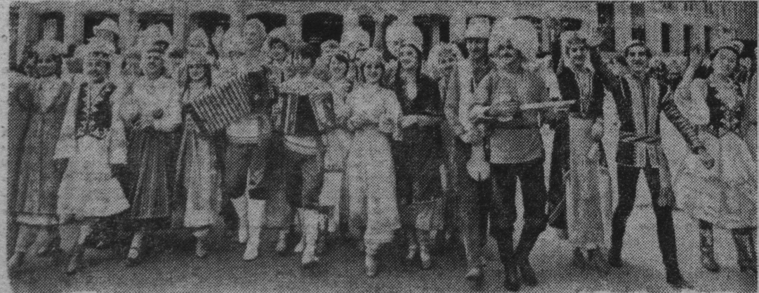
«Привет тебе, Олимпиада!»

Бассейн «Олимпийский». Прыжки в воду с трехметровой трамплина. Олимпийской чемпионкой стала советская спортсменка Ирина Калинина. НА СНИМКЕ: «золотой» прыжок.