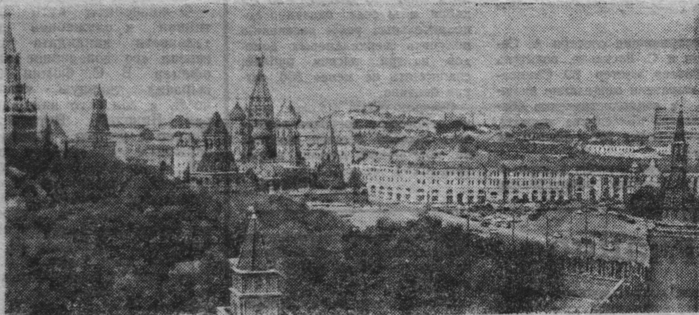
Москва сегодня. Вид на Кремль с набережной Мориса Тореза.

В монографии раскрывается взаимодействие научно-технического и социального прогресса, рассматриваются формы органического соединения преимуществ социалистической системы хозяйства с достижениями научно-технической революции. Автор прослеживает влияние НТР на развитие общественной собственности, на сближение ее двух форм, существующих при социализме, и перерастание их в единую коммунистическую форму. В книге дан анализ процессов преодоления существенных различий между городом и деревней, между умственным и физическим трудом.