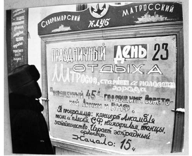
В 50-60гг. Базовый матросский клуб на Советской был центром культурной жизни.

Предполагалось довести пути до Окольной, но там оползневый район, поэтому строительные работы