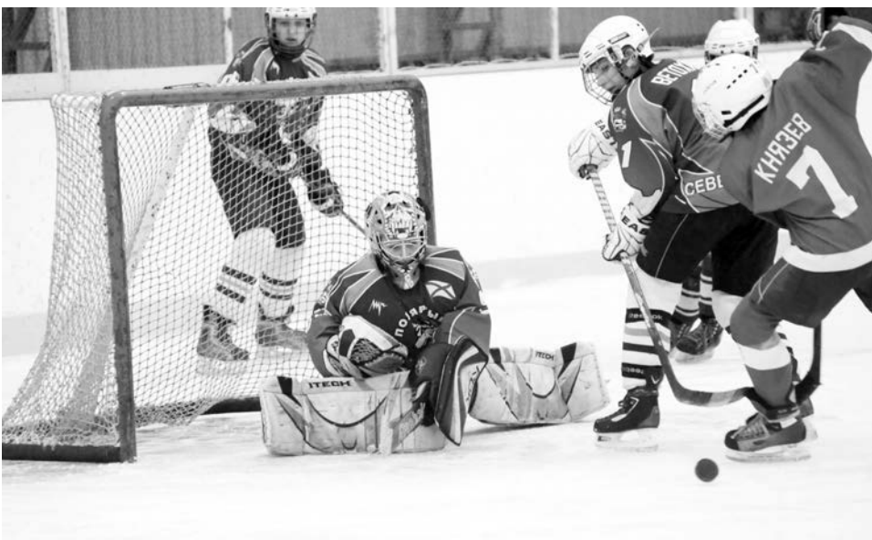
Как ни старались североморцы, подгоняемые гулом полных трибун, избежать разгрома им не удалось.