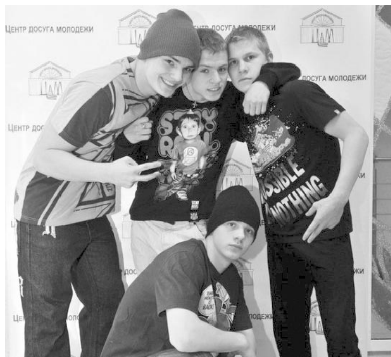
У хип-хоперов «CANDY'S SHOW» уже есть идеи, чем удивить североморцев.