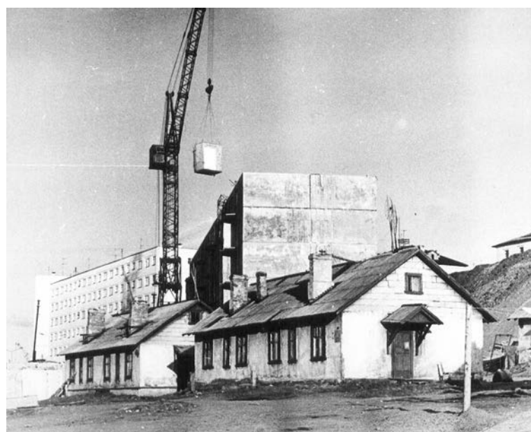
Последние финские дома на ул.Надгорной, ныне – Саши Ковалева, 1975-76гг.