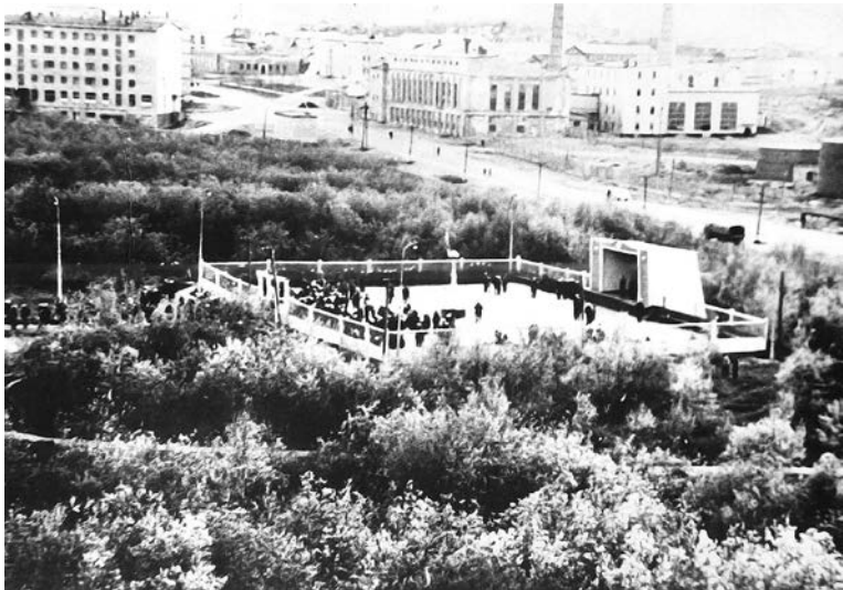
В 60-х годах на танцплощадке городского парка соединилось немало любящих сердец.

Куда бы нас ни забросила судьба, этот город на берегу Кольского залива навсегда останется в нашей памяти. Есть в нем что-то приворотное, неповторимое, заставляющее и взрослых, и детей снова и снова искать слова для признания ему в любви, подбирать гармонию звуков, выводить на бумаге такие разные и такие знакомые очертания своего Города.