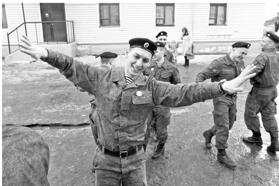
Эх, яблочко! В заводном молодецком танце закружились срочники из «Убойной силы».

готовленными военными и воспитанниками патриотических и спортивных клубов по городу бегали и хрупкие девушки.