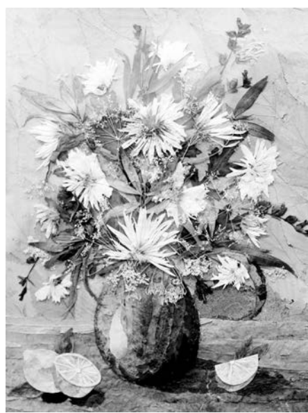
«Лимонное настроение» – иванчай, серебристый тополь и розы.