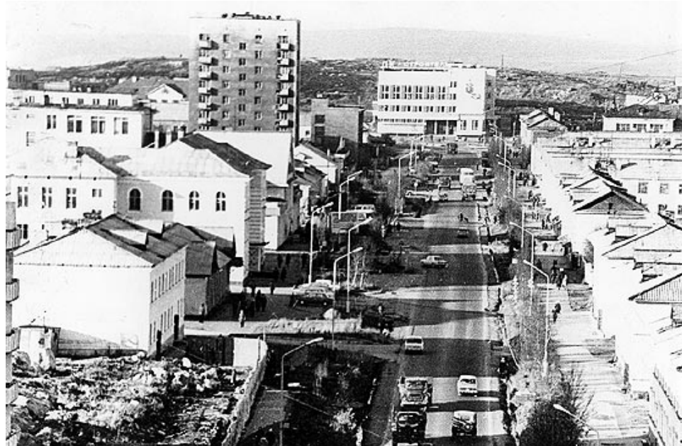
Улица Советская узнаваема на любых архивных снимках.

приостановили, а часть дороги разобрали, так что доходит она только до 75 КЖИ. Кстати, была в Североморске и улица Железнодорожная. Располагалась она на въезде в Авиагородок. По правой стороне там стояло два дома железнодорожников.