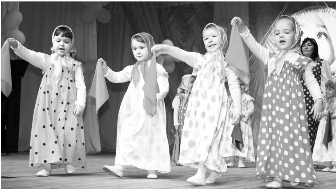
Юные матрешки д/с №31 хотят, чтобы счастливое детство было у каждого ребенка.

В рамках акции «Спаси ребенка» североморцы собрали более 1 миллиона рублей.