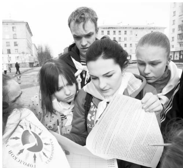
На первом этапе участники игры должны были ответить на вопросы по истории города.