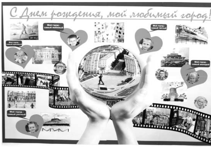
«С праздником, любимый город!», д/с №47.