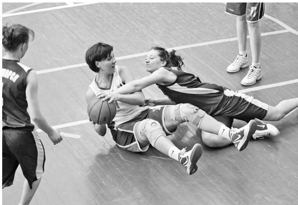
Несмотря на счет, в отсутствии самоотдачи наших девушек упрекнуть было нельзя.

Когда на баскетбольную площадку вышли женские сборные, рисунок игры практически не изменился. А вот по очкам преимущество мурманчанок ока-