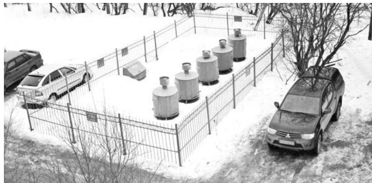
Парковку возле газовых резервуаров можно расценить как препятствование эксплуатации зданий (ст.5 Закона Мурманской области «Об административных правонарушениях»).