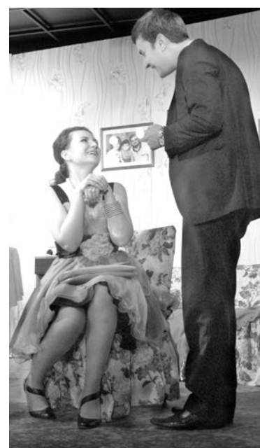
Двухчасовая пьеса посвящена поиску себя.