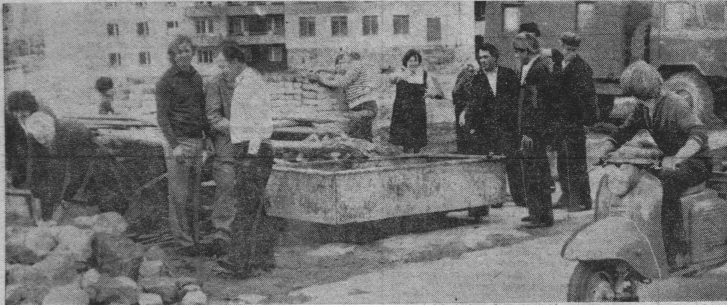
На субботнике — коллектив горгаза.

Репортаж с субботника вел Я. ЗУБАРОВ, Г. ЛЕВИЦКИЙ, В. НЕКРАСОВА, В. СТЕПНОЙ.