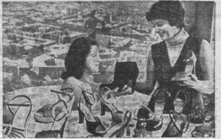
Армянская ССР. Коллектив ордена Трудового Красного Знамени Ереванского производственного обувного объединения «Масис» еще 29 августа 1979 года рапортовал о досрочном выполнении четырехлетнего плана пятилетки. НА СНИМКЕ: образцы модельной женской обуви, к производству которой приступил коллектив обувного объединения «Масис».