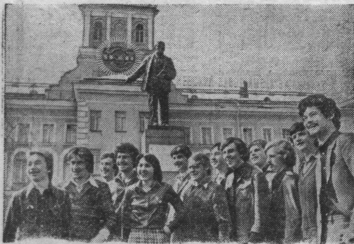
Ленинград. Большое внимание в объединении «Невский завод» имени В. И. Ленина уделяется профессиональной ориентации молодежи. С этой целью действует отдел технического обучения. Свои первые шаги молодые машиностроители делают под руководством опытных наставников.

СНИМКЕ: группа молодых машиностроителей.