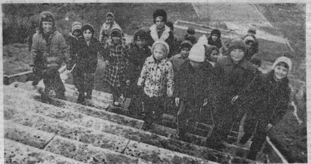
вие в увлекательный мир знаний, знаний об окружающей ребятшке действительности. В экскурсиях по городу она рассказывает ученикам о силь-