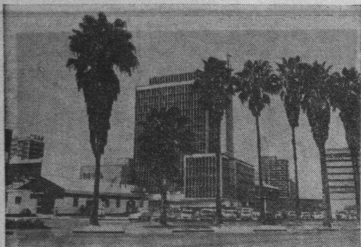
Солсбери. На карте Африки появилось новое 50-е независимое государство — Зимбабве, ознаменовавшее конец девятидесятилетнему колониальному господству Англии над народом этой страны.

Незаконный режим оставил в наследство Зимбабве множество трудных проблем. Освободившемуся народу предстоит прежде всего ликвидировать дискриминацию африканских трудящихся в различных областях жизни, решить сложные вопросы развития национальной экономики и государственной самостоятельности.