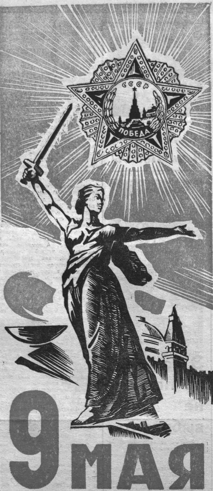
Плакат В. Егорова.