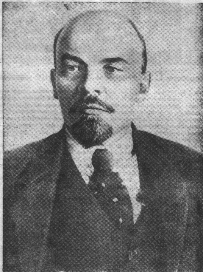
В. И. Ленин. Москва, октябрь 1918 года.