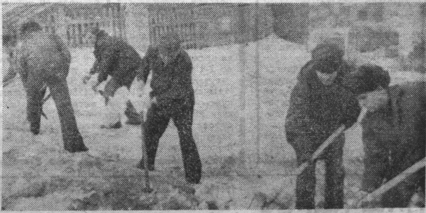
НА СНИМКЕ: электромонтеры городской электросети работали на вводе теплотрассы к новому административному зданию.