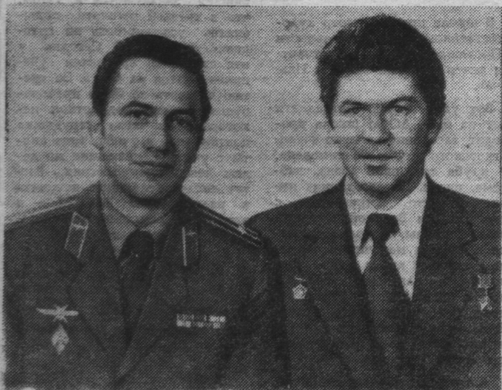
Экипаж космического корабля «Союз-35» — командир корабля подполковник Леонид Иванович Попов (слева) и бортинженер-лётчик-космонавт СССР, Герой Советского Союза Валерий Викторович Рюмин.