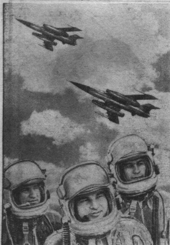
Мы охраняем мир на земле. Фотоплакат Н. Акимова и О. Кузьмина.

13 апреля — День войск противовоздушной обороны страны