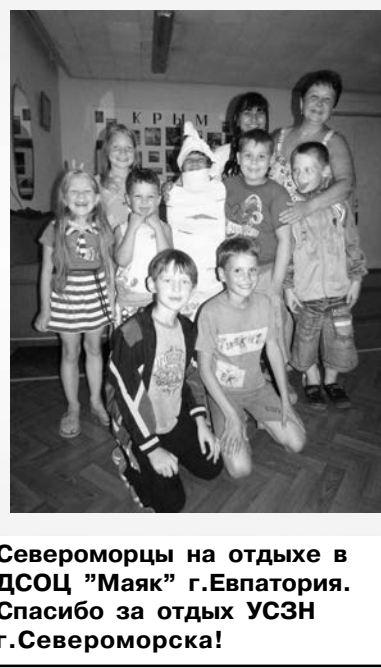
Североморцы на отдыхе в ДСОЦ "Маяк" г.Евпатория. Спасибо за отдых УСЗН г.Североморска!