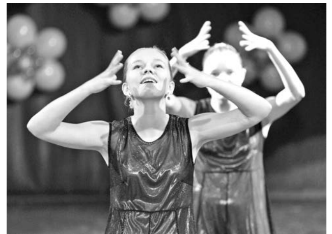
Воспитанницам КШИ №3 г. Мурманска для выражения чувств достаточно музыки и жестов.

тимально явилась театральная постановка артистов Центра досуга молодежи. Коллектив этого учреждения подключился к российско-норвежскому проекту по изучению доступности социальной среды для инвалидов. В рамках его в ЦДМ идет работа над постановкой спектакля «Город мечты», отрывок из которого был показан в субботу. Премьера спектакля намечена на следующий год – в день IV фестиваля «Мы вместе». Ну а уже завтра в Центре досуга молодежи пройдет подведение итогов проекта Североморской городской организации Всероссийского общества инвалидов «Люди на колясках» за минувший год и презентация следующего. Организаторы и