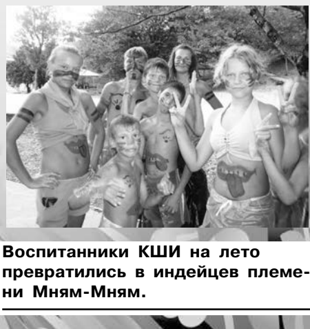
Воспитанники КШИ на лето превратились в индейцев племени Мням-Мням.