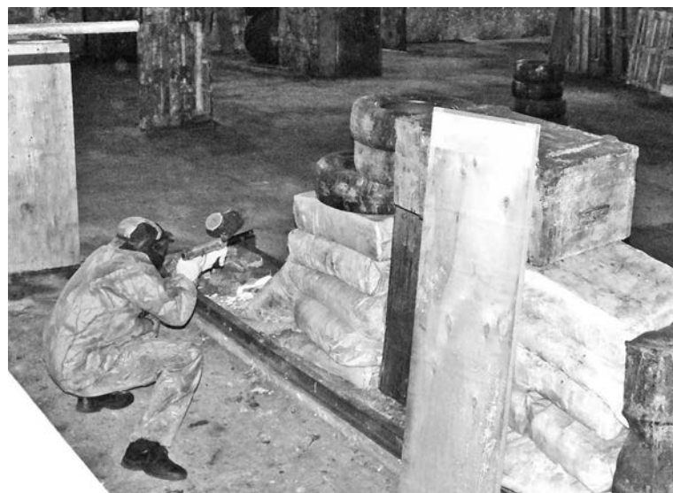
Следующий турнир по пейнтболу пройдет в феврале.