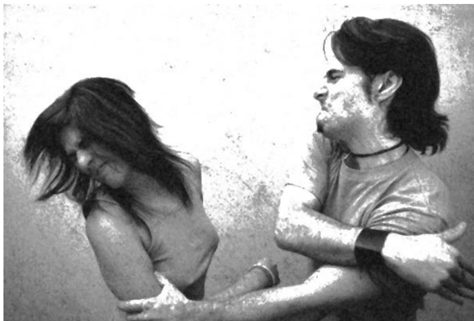
Очень часто жертвы домашнего насилия, в отличие от нашей героини, сами забирают заявления из ОВД.

- Я проснулась, словно от толчка. Несколько секунд соображала, что происходит. Потом начались выстрелы. Мы с подругой выбежали из квартиры на лестничную площадку, закрыли за собой дверь и вытащили ручку, чтобы он не смог выйти вслед за нами. В подъезд выбежали соседи, в том числе беременная женщина со 2 этажа. У кого-то проснулись дети, все начали звонить в милицию. Кто-то накинул на нас теплые вещи, потому что мы были в