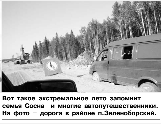
Вот такое экстремальное лето запомнит семья Сосна и многие автопутешественники. На фото – дорога в районе п.Зеленоборский.