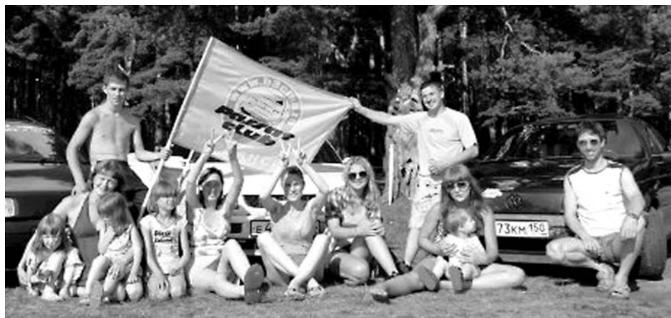
На пути к хорошему настроению километры северян не страшат.

"Пассат В3 Клуб" образовался 6 лет назад как сообщество владельцев авто-