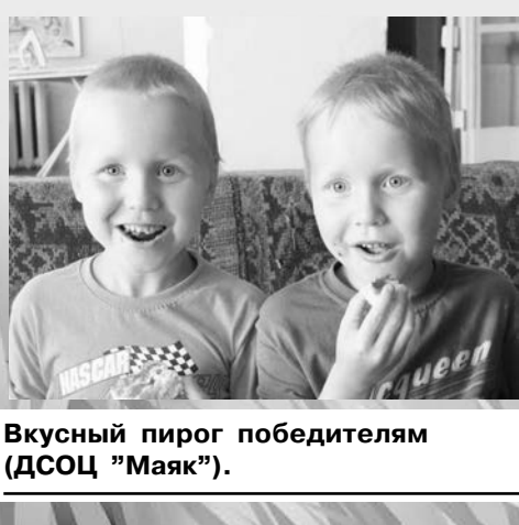
Вкусный пирог победителям (ДСОЦ "Маяк").