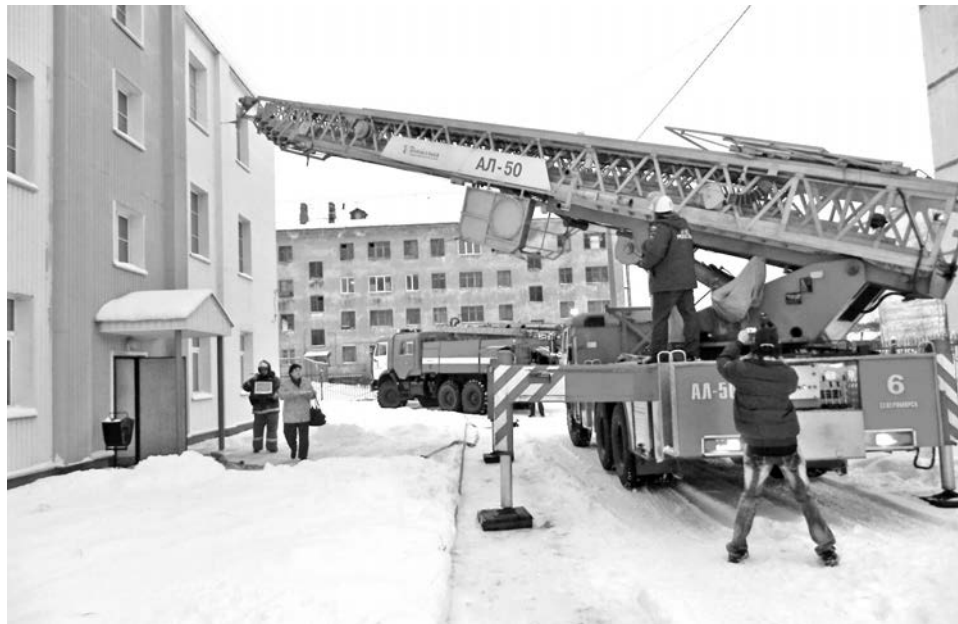
По легенде учений, пострадавших эвакуировали с помощью пожарной автолестницы.

Главной целью тренировки была отработка экстренной помощи и первичные действия при пожаре. Проверены действия не только спасателей, но и работающего персонала, а также самих