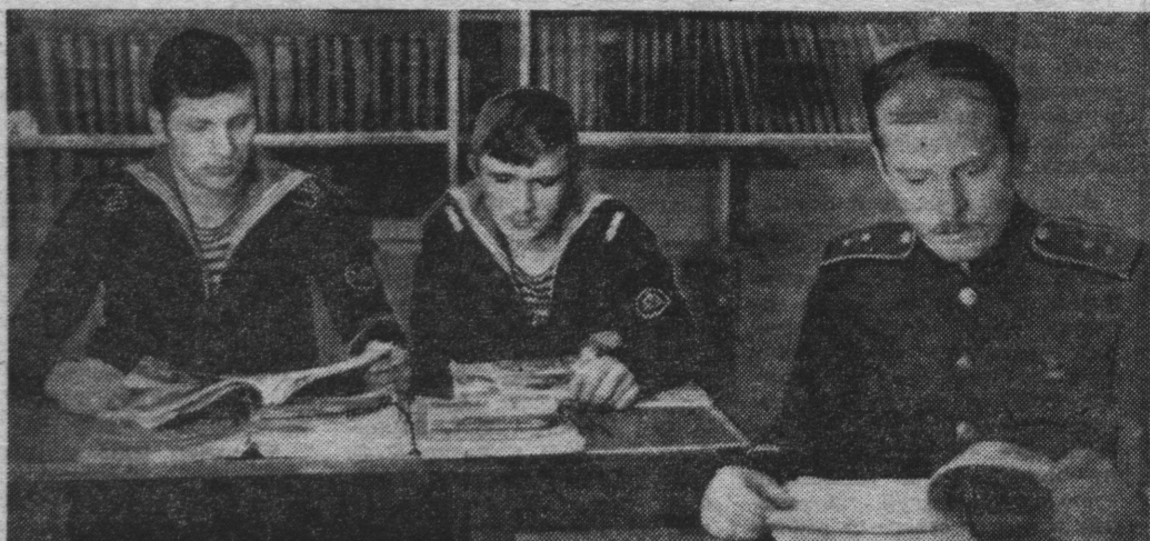
Будни армии и флота: в матросской библиотеке.

Репортаж с урока в Североморской школе № 9