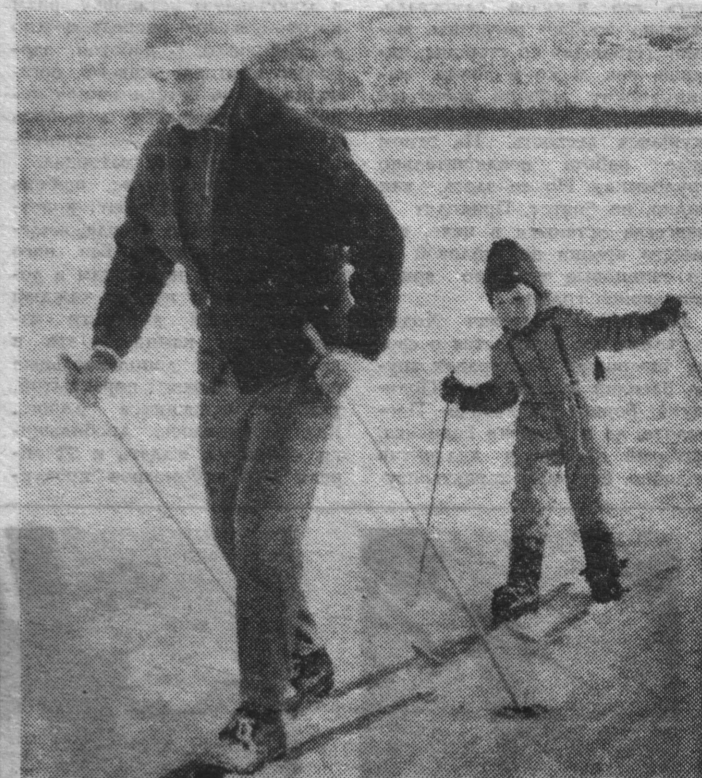
— Шире шаг, папа!