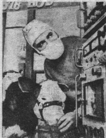
ЧССР. Успешно провели операцию по внедрению теленку искусственного сердца ученые чехословацкого города Брно. Как само сердце, так и блоки питания и контроля разработаны и изготовлены специалистами из ЧССР.