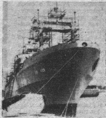
ГДР. За минувшие тридцать лет на верфи «Фольксверфт» в городе Штральзунде построено свыше тысячи судов различных типов для Советского Союза.