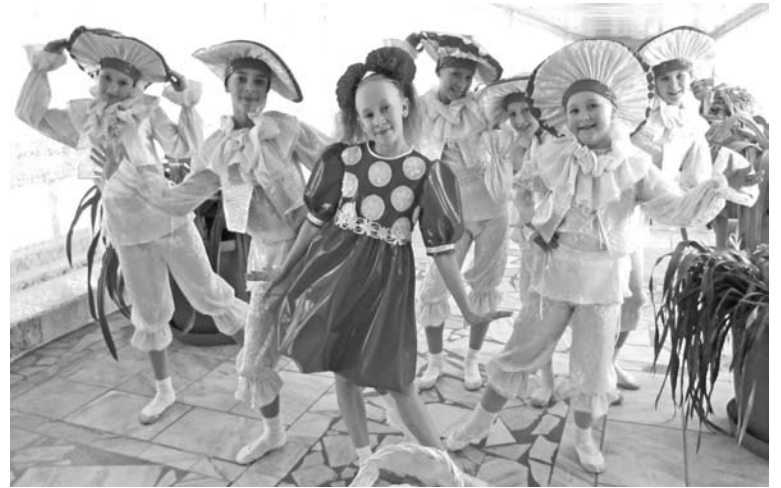
Участникам «Next» очень понравилось жюри, в состав которого вошли артисты театра танца «Ритмы планеты».

Старшая группа недавно приехала из Архангельска, где проводился 15-й Международный фестиваль детского и юношеского творчества «Роза ветров», в