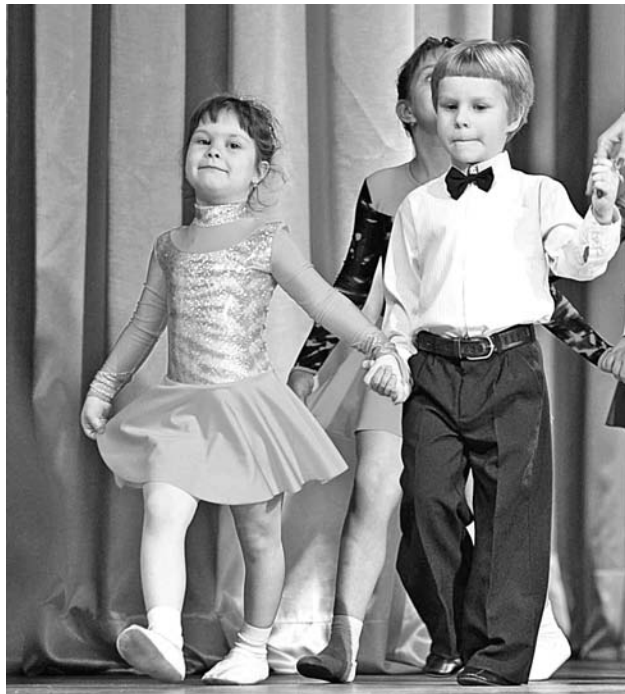
В бальных танцах главное - не только мастерство, но и вдохновение, эмоции, кураж, если хотите. Такой коктейль поможет вырастить из неуклюжих малышей танцоров международного класса.

Танцоры трех коллективов из ДК «Строитель» и ДК «Судоремонтник» поселка Росляково – «Альянс», «Альянс-дэнс» и «Овация» - представили свое мастерство не только в соревновательной, но и показательной частях праздника. Самые маленькие – группа «Первые шаги» - исполняли по четыре танца – смесь европейской и латиноамериканской программ. Ребята постарше уже шесть: медленный и венский вальсы, квикстеп, самбу, ча-ча-ча и джайв.