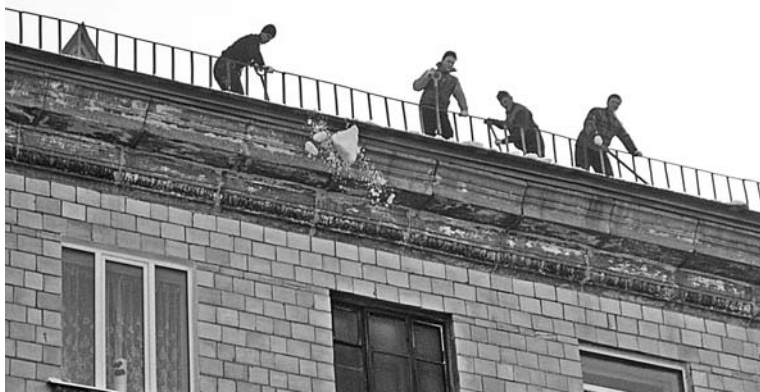
Скатные кровли чистят от снега промышленные скалолазы. На ул.Сафонова работают специалисты мурманского ООО «Векшин».

Анастасия ЧЕРНИКОВА.