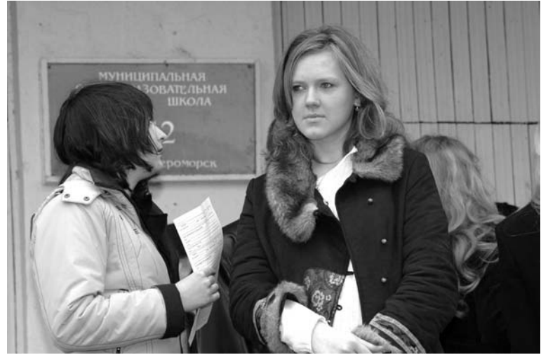
Пробный ЕГЭ по математике пройдет уже 14 апреля.

– На едином госэкзамене при себе необходимо иметь гелие-