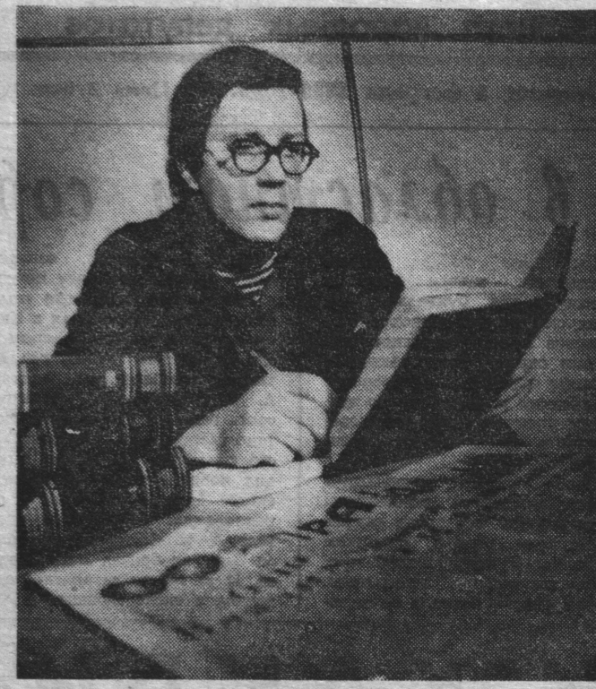
Мы узнали много нового из жизни вождя, отданной народу. Будем работать и жить, как учил он». В. КНЯЗЕВ, корр. ТАСС.