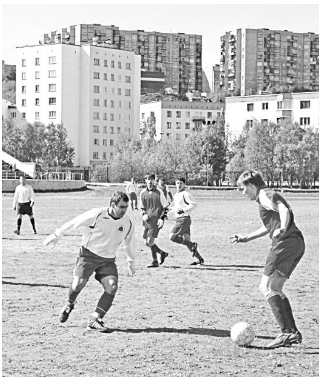
Какая боль, какая боль! «Колатом» - «Североморск», 4:0.