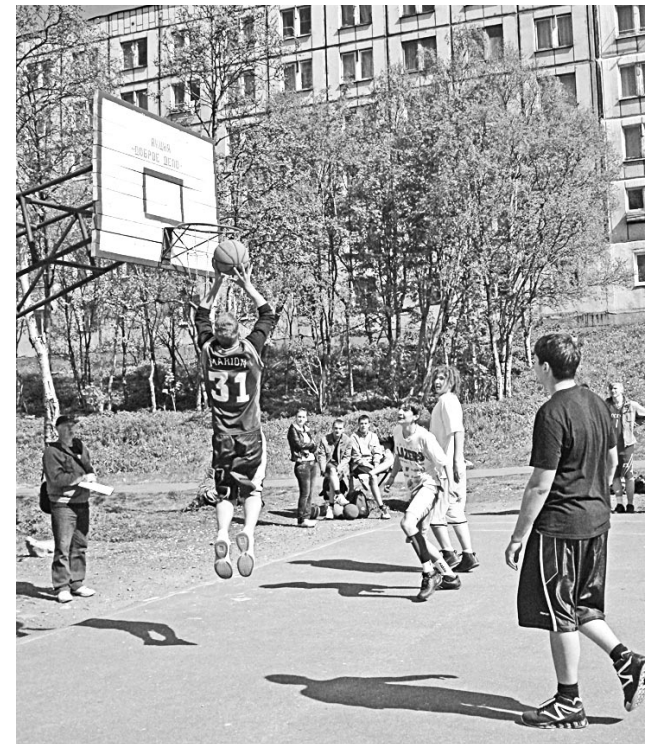
На ул.Флотских Строителей состязались баскетболисты.