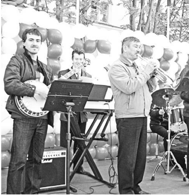
Ритм на танцевальной площадке задавал диксиленд «Джаз-Бэнд» из ЦДМ «Россия».