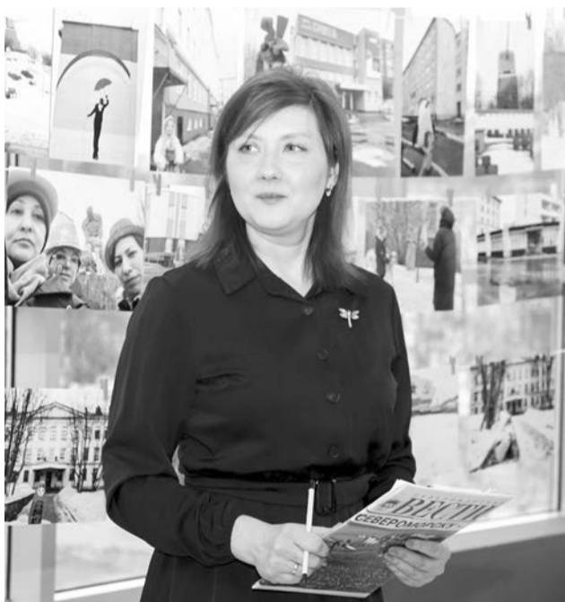
Автор проекта Ирина Кузьмина.

— Если нам удалось вдохновить кого-то на изучение незнакомых страниц истории нашего города, если мы кому-то помогли посмотреть на Североморск с другой стороны, полюбить его ещё больше, то