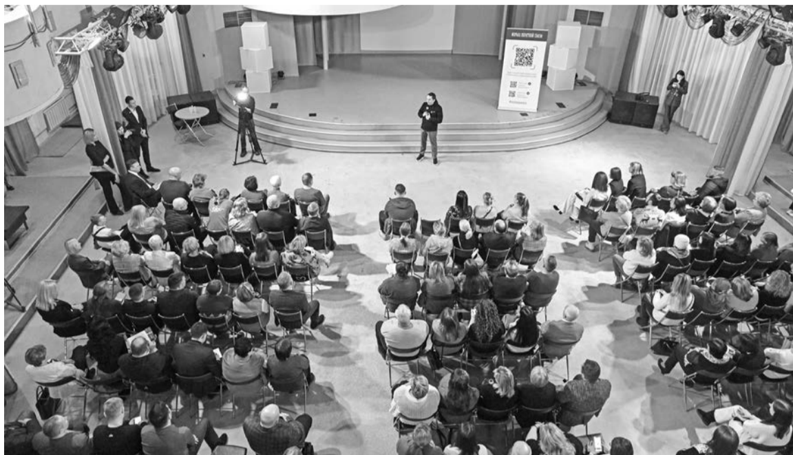
На встречу с главой региона в Центр досуга молодёжи пришли более ста североморцев.

ности его военнослужащих служат в нашем регионе (это не считая других подразделений Вооружённых сил РФ). В ряде населённых пунктов региона доля военнослужащих составляет 90 процентов. Поэтому в 2021 году в рамках стратегического плана «На Севере — жить» и с учётом отдельных поручений Президента России и правительства РФ мы запустили эту работу, — сказал губернатор.