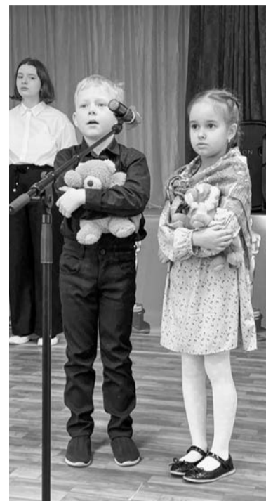
Сцена из постановки «Непокорённые». Учащиеся школы №12.

офицеры, захватив больницу, сначала отобрали у пациентов все продукты, обрекая их на голодную смерть. А потом убили 530 человек, чтобы освободить больничные помещения и устроить там конюшни.