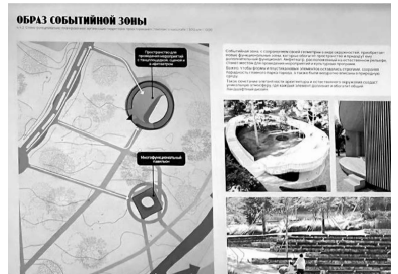
Такой авторы проекта представляют событийную зону городского парка.

В работе для архитекторов, проектировщиков важно сохранение исторической ценности места, уникальности природы, ключевых пространств. Каждый элемент концепции должен гармонично вписываться в общий ландшафтный дизайн. В задачи проекта также входит установка нормативных пандусов, визуальное и физическое разделение велосипедных, пешеходных потоков, расстановка нормативного освещения, проработка визуальных световых акцентов разных функциональных зон,