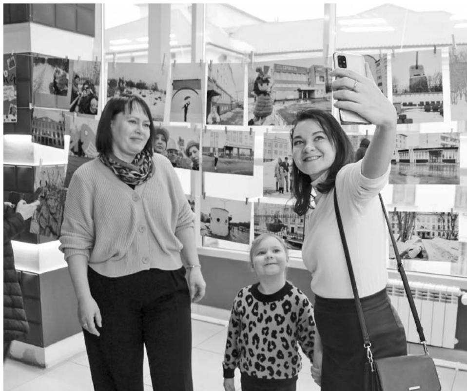
Команда «Ремесленники» с удовольствием делала селфи на фоне фотосушки.