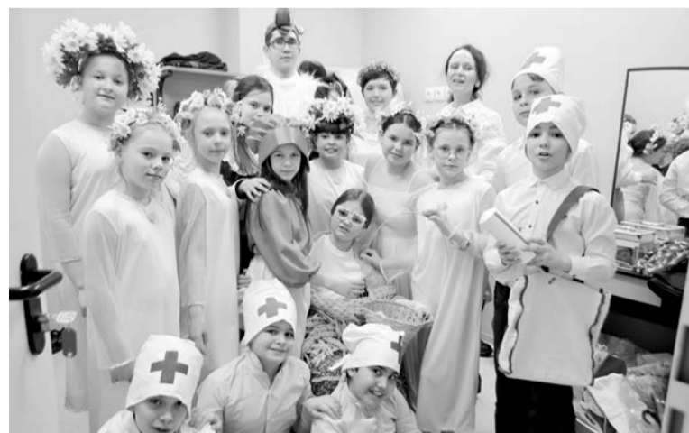
Театр «Истоки» лица №1 представил постановку «Красная Шапочка и Вирус Волк».