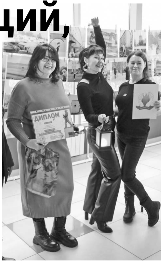
В команде «Семейный очаг» были и новички, и опытные участники.

квеста команда школы №11 «Серебристая чайка» получила отдельный приз за лучший кадр.