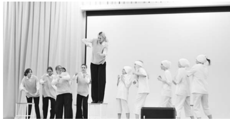
Фрагмент спектакля «Оскар. Письма» по сценарию Т. Раздоружной по роману Э. Шмитта «Оскар и Розовая дама».