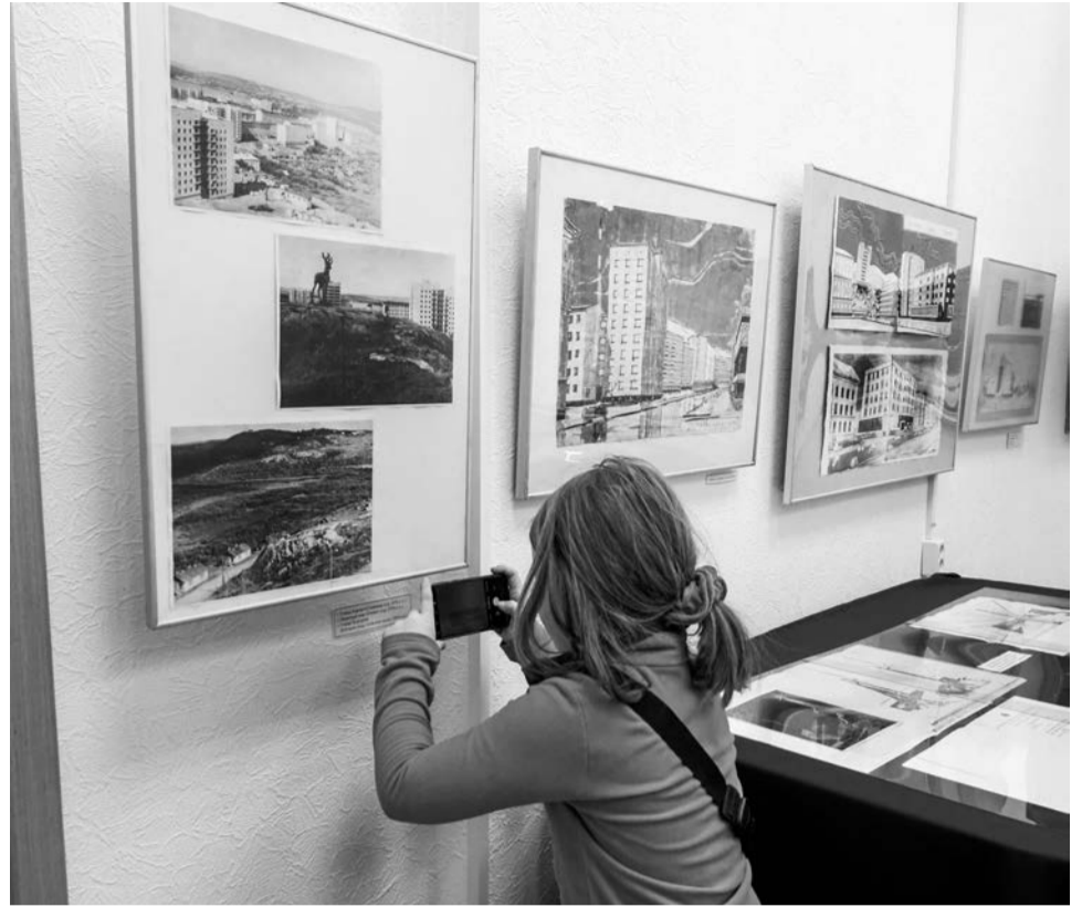
И взрослые, и юные посетители выставки старались разглядеть и запечатлеть каждый экспонат.

В экспозицию вошли материалы не только из фондов Североморского Музейно-выставочного комплекса, но и муниципального архива ЗА-