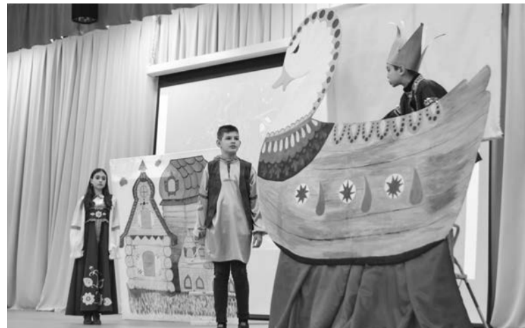
Театральная труппа школы №11, представившая постановку «Летучий корабль», была отмечена за лучший театральный дизайн.