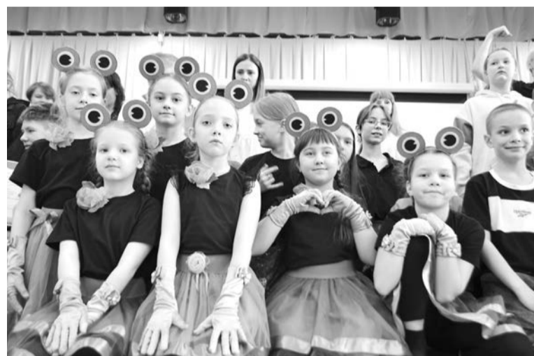
Актрисы из театра «Образ» школы №11.