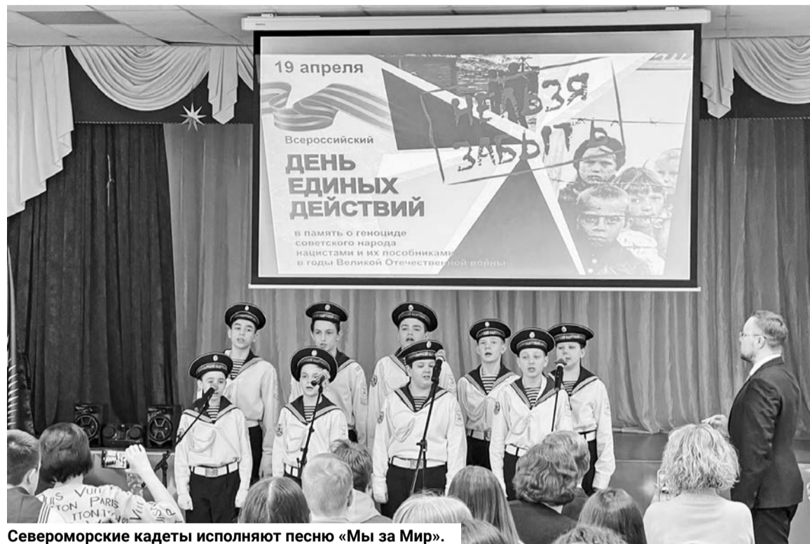
Североморские кадеты исполняют песню «Мы за Мир».