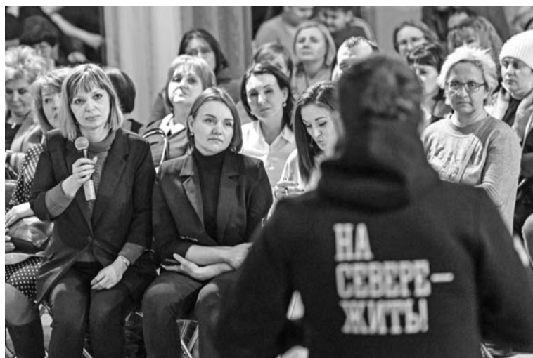
Все заданные губернатору вопросы были взяты в работу.

общего пользования, снос оставшегося пустующего аварийного жилья, а также ремонт ещё 53 пустующих квартир.