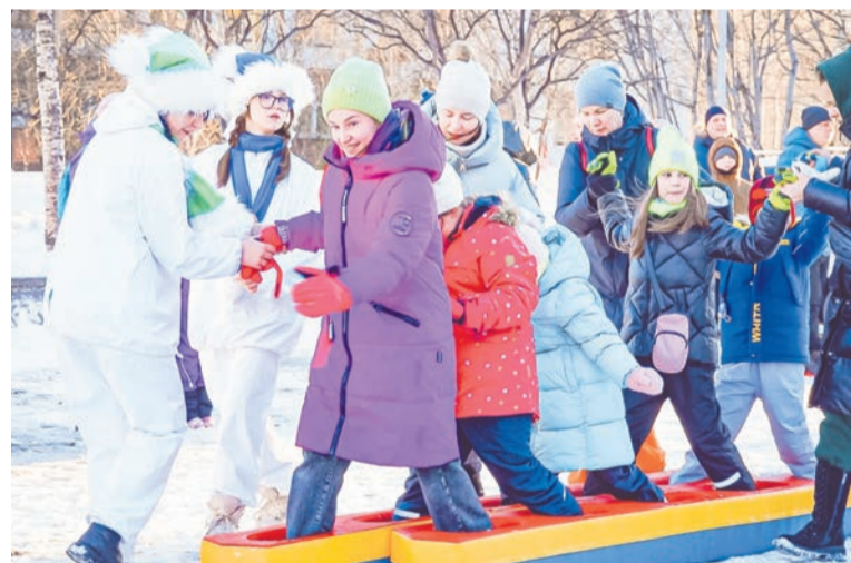
Лыжню! Импровизированные «командные» лыжи заставили участников сосредоточиться и попотеть, чтобы дружно идти в ногу.