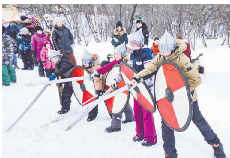
На площадке «Ратное дело» мальчишки были рады почувствовать себя настоящими богатырями.