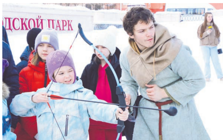
Возможностью пострелять из лука спешили воспользоваться и дети, и взрослые.