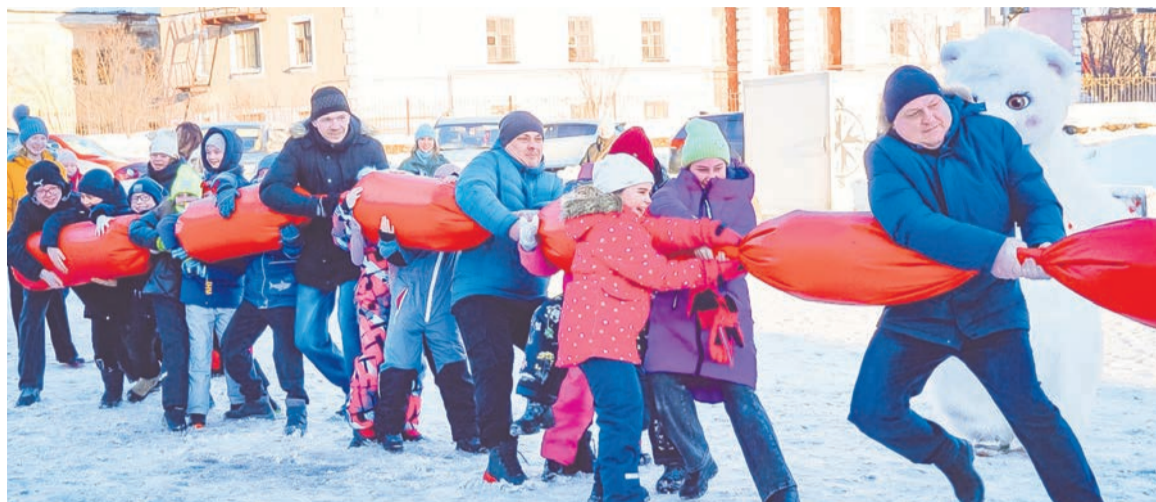
В перетягивании каната детворе помогли и мамы, и папы, каждая команда стремилась к лидерству, но победила дружба.

Подготовила Татьяна ЛИТОВЧЕНКО.