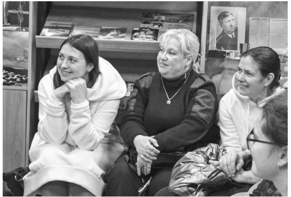
Участников презентации ждал увлекательный экскурс по страницам «Мажорно-минорных рифм».

Участников презентации ждал увлекательный экскурс по разделам сборника: стихи и песни в исполнении автора, артистов ансамблей «Морская душа», городского Дворца культуры г. Ейска, хора «ХорОшки» Детской музыкальной школы им. Э.С. Пастернак, заслуженного артиста ЛНР, соли-