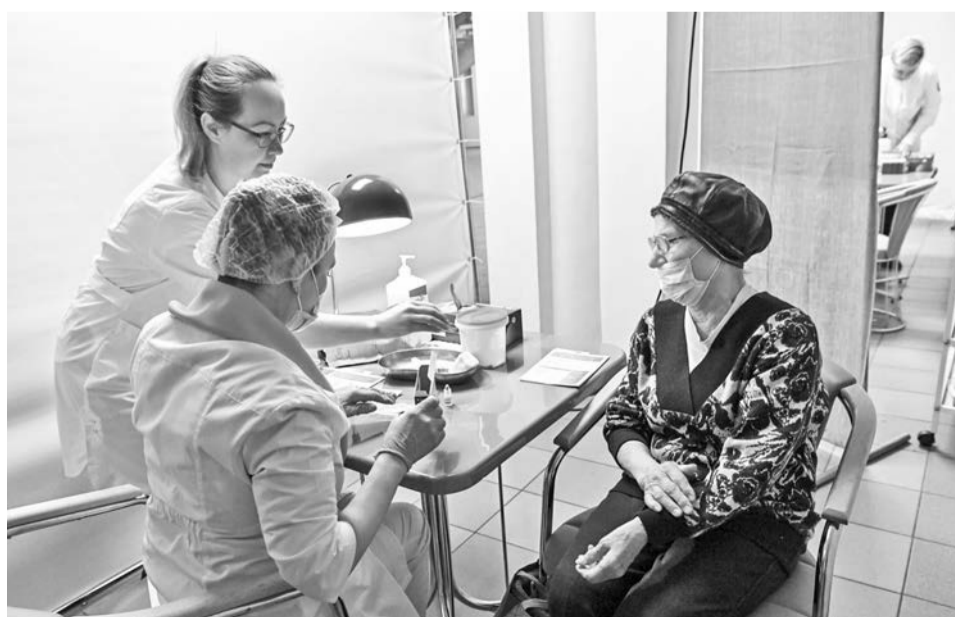
Забор крови в пункте витаминизации проводит медперсонал Североморской ЦРБ.