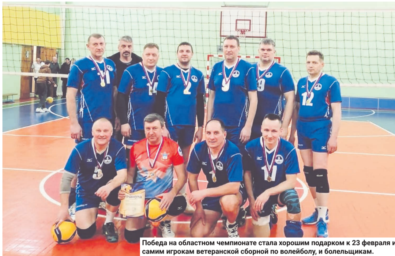
Победа на областном чемпионате стала хорошим подарком к 23 февраля и самим игрокам ветеранской сборной по волейболу, и болельщикам.

Оба коллектива выступали по второму спортивно-му разряду.