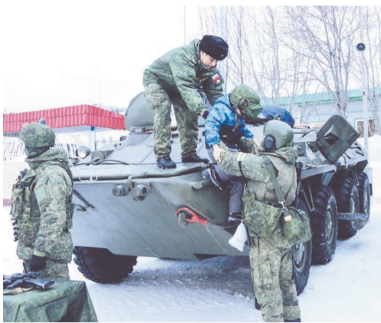
Залезть на БТР - первоочередная задача для ребят, пришедших на выставку военной техники.

День защитника Отечества не одно десятилетие считается праздником истинного мужества и воинской доблести. 23-го февраля чествуют тех, кто сражался за страну в годы Великой Отечественной войны, и тех, кто выбрал профессию военнослужащего и сейчас стоит на страже её рубежей.