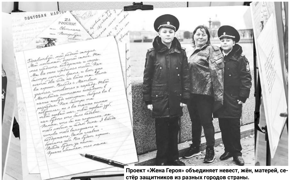
Проект «Жена Героя» объединяет невест, жён, матерей, сестёр защитников из разных городов страны.