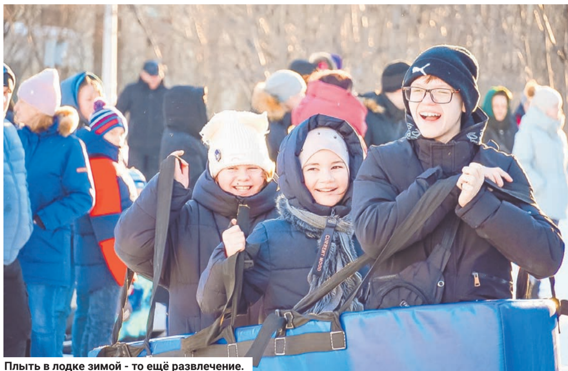
Плыть в лодке зимой - то ещё развлечение.