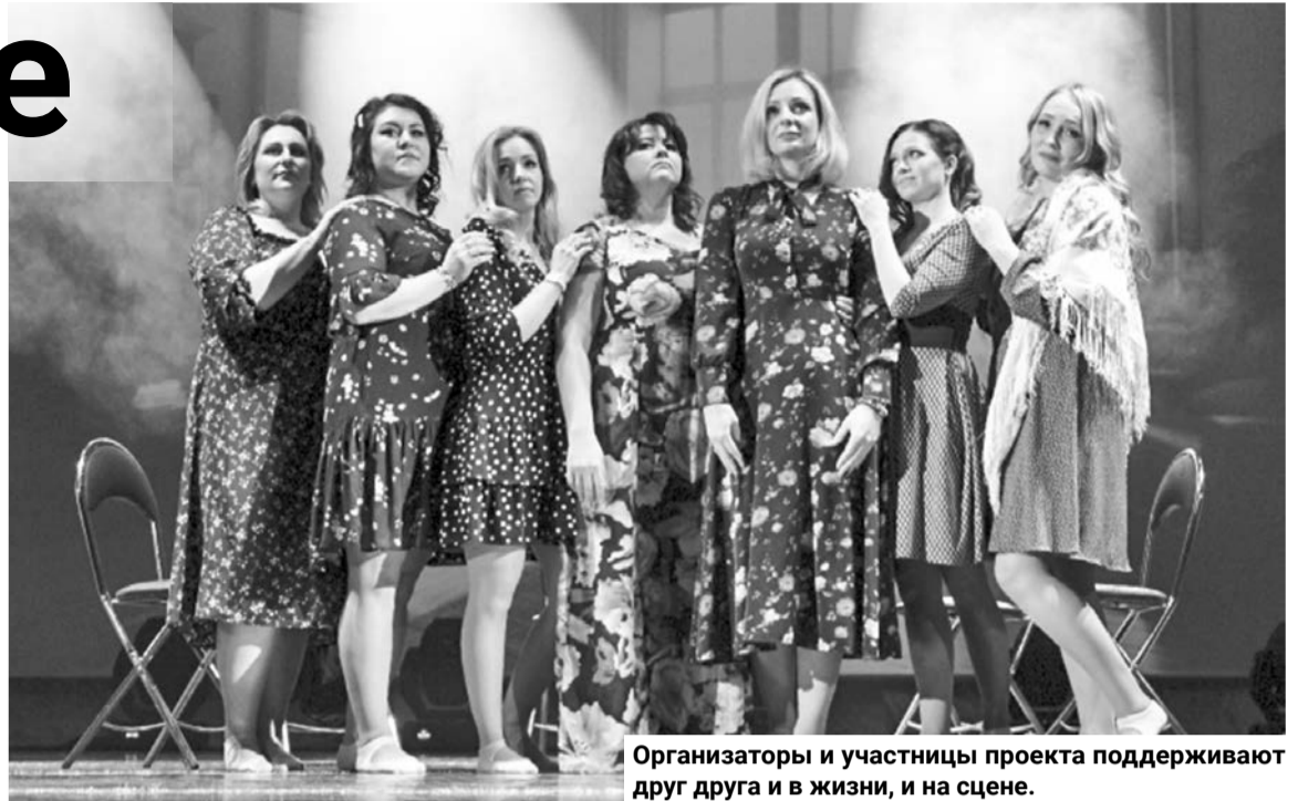
Организаторы и участницы проекта поддерживают друг друга и в жизни, и на сцене.

ков — 23 Февраля и 8 Марта. Я хочу пожелать нашим мужчинам защитникам вернуться с победой, а женщинам — встретить их радостными улыбками и счастливыми горящими глазами. Мирного неба и скорейшей победы, — сказал глава ЗАТО г. Североморск Олег Прасов.