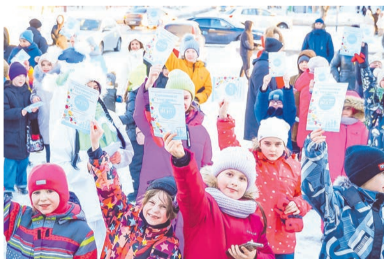
А на память - сертификаты участника, классные воспоминания и свежие фрукты.