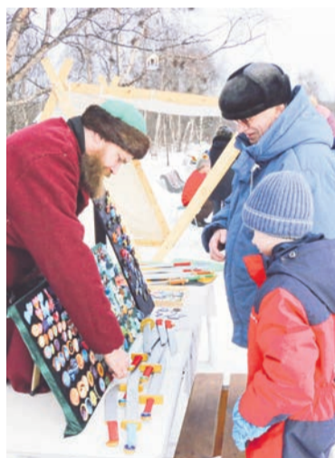
В ходе праздника североморцы могли приобрести сувениры.