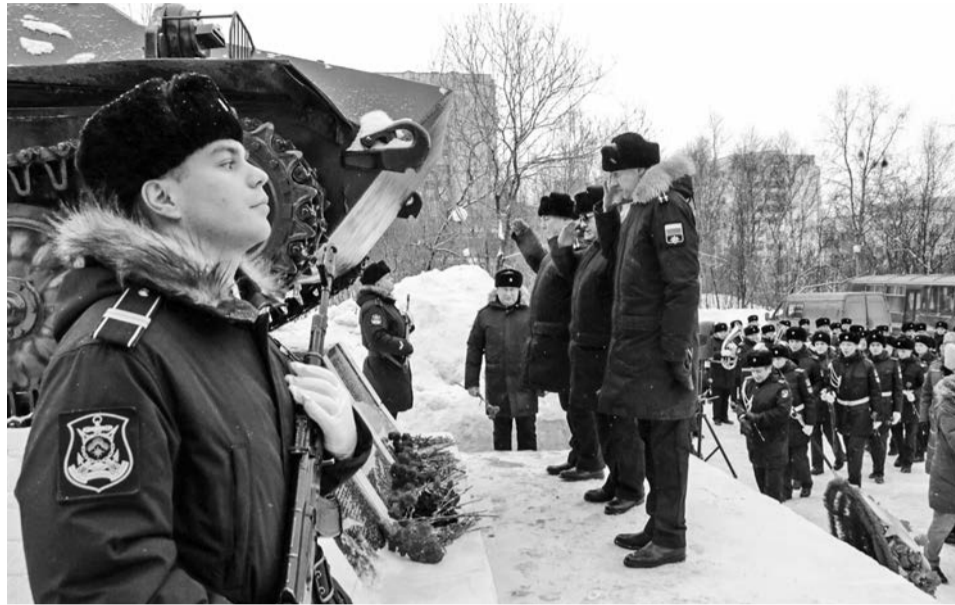
Военнослужащие Северного флота возложили цветы к мемориалу.