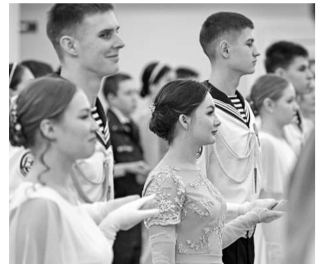
К танцевальной подготовке северноморские кадеты относятся так же серьёзно, как к огневой или строевой.