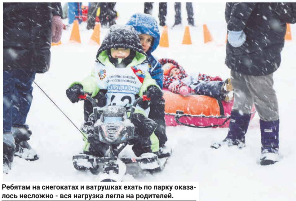
Ребят на снегокатах и ватрушках ехать по парку оказалось несложно - вся нагрузка легла на родителей.

ставители клуба «Беговелики» провели с детшками разминку под музыку, а потом пришло время стартовать. Дистанцию можно было преодолеть на лыжах, снегокатах, санках и ватрушках.