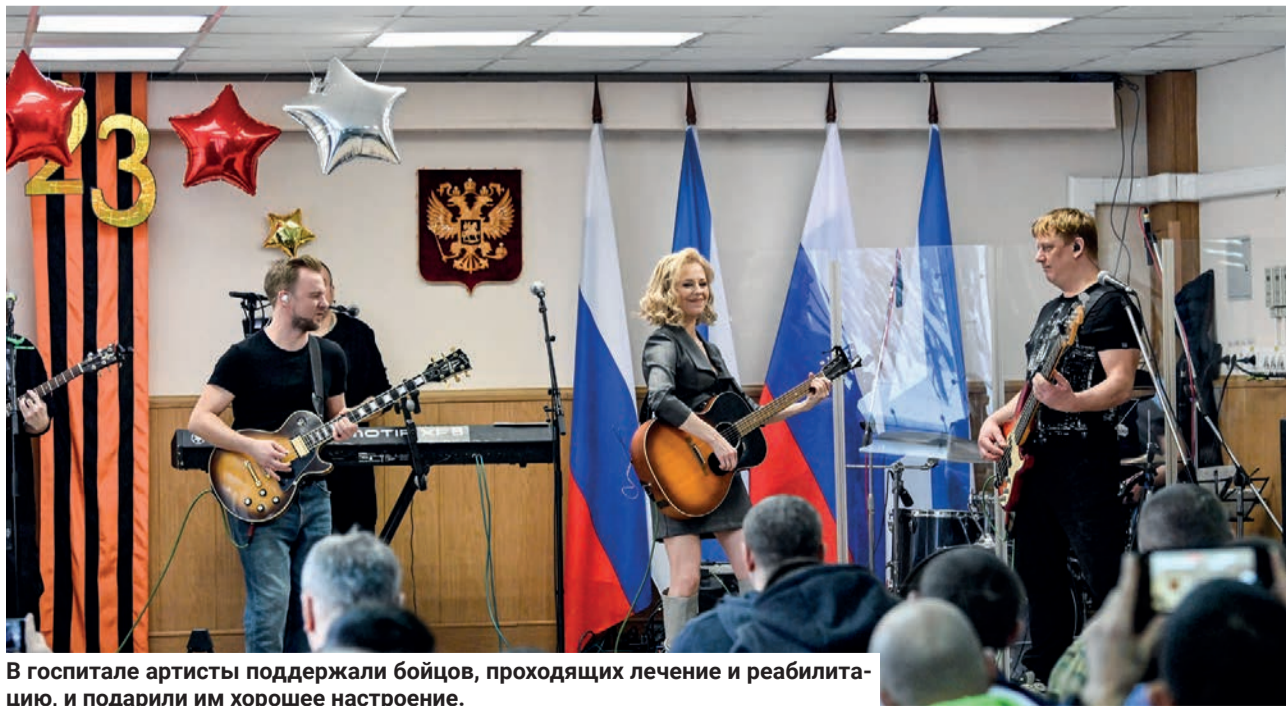
В госпитале артисты поддержали бойцов, проходящих лечение и реабилитацию, и подарили им хорошее настроение.