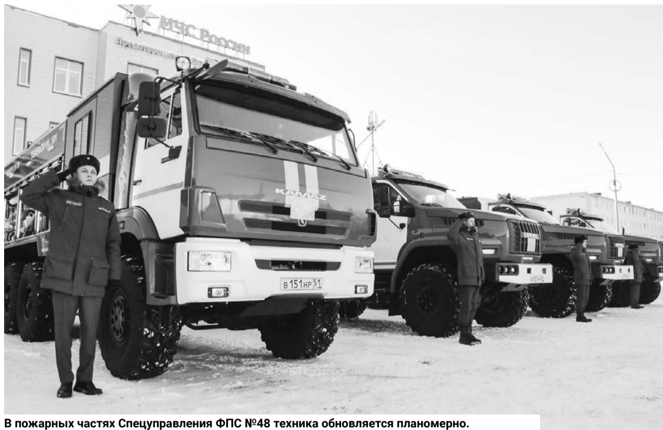
В пожарных частях Спецуправления ФПС №48 техника обновляется планомерно.

Три автоцистерны на базе «Урал Next» будут находить-