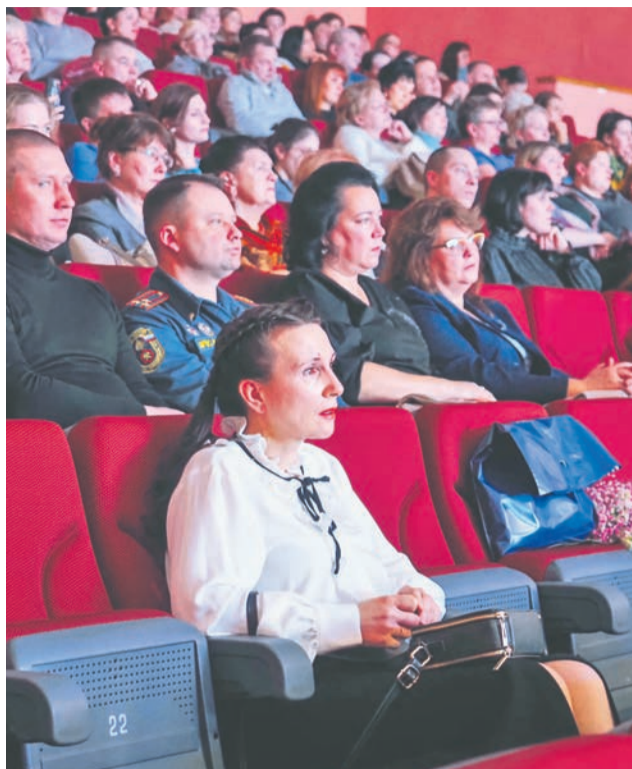
Выступления музыкантов до глубины души трогали североморцев.