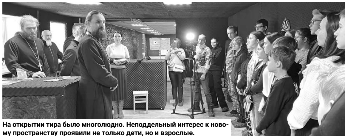
На открытии тира было многолюдно. Неподдельный интерес к новому пространству проявили не только дети, но и взрослые.