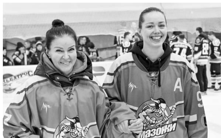
Женская хоккейная команда «К-21. Амазонки» создана 5 марта 2020 года.