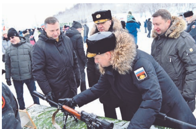
Выставка вооружения на Приморской площади привлекла внимание руководства города и флота.

Автоколонна из 30 автомобилей несл государственных флаги РФ, Андреевские стяги, флаги и эмблемы морской пехоты России и Северного фло-