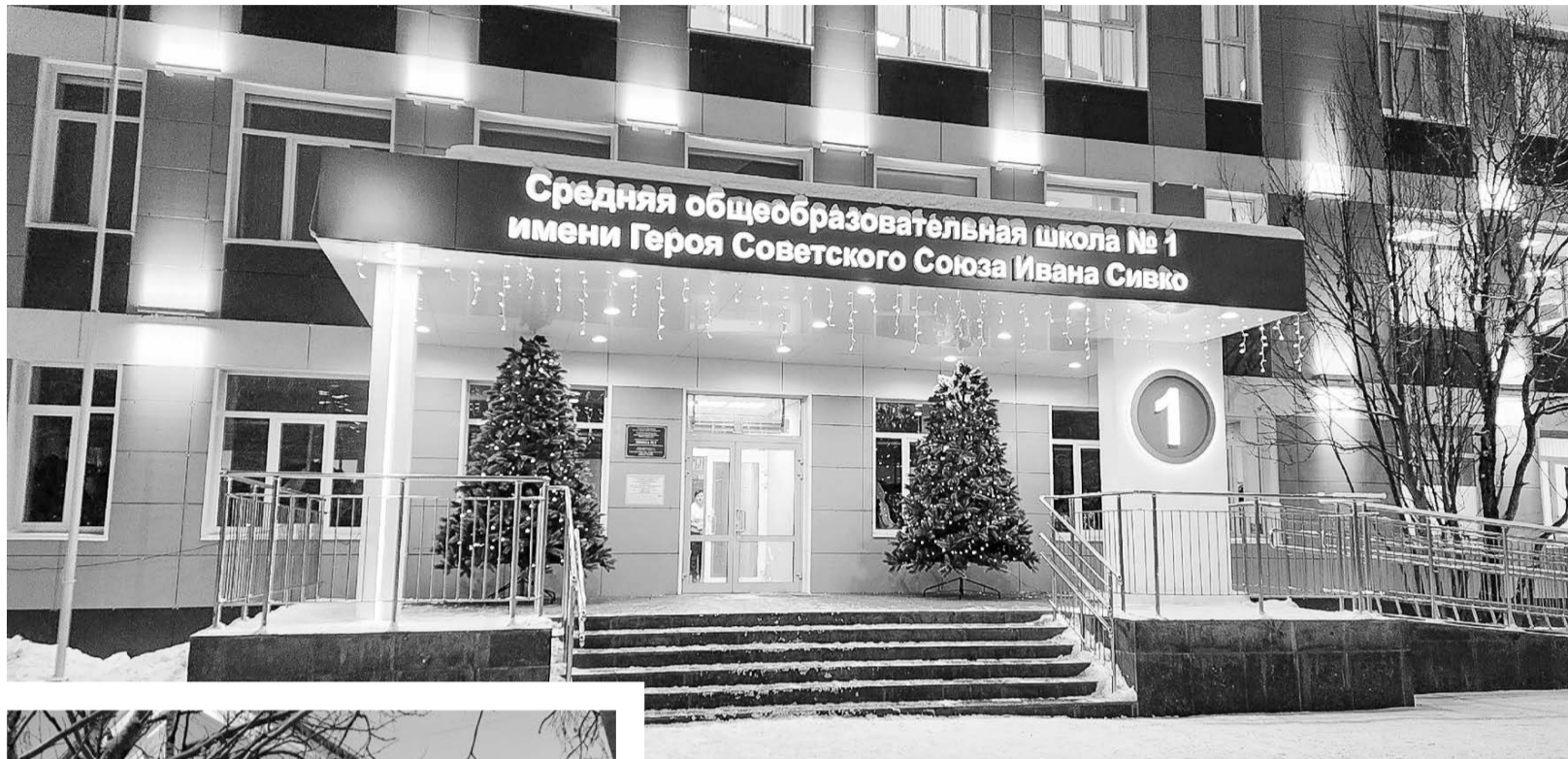
Украшение школы №1 ёлочками и иллюминацией оценили не только школьники, но и жители близлежащих домов.