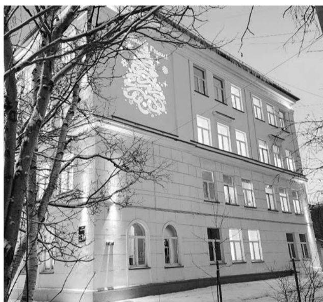
Яркая картинка появилась на фасаде школы №10 благодаря слайд-проектору.

в рамках федеральной программы по модернизации школьных систем образования, инициированной Президентом Российской Федерации, а также реновации ЗАТО, у главного входа гар-