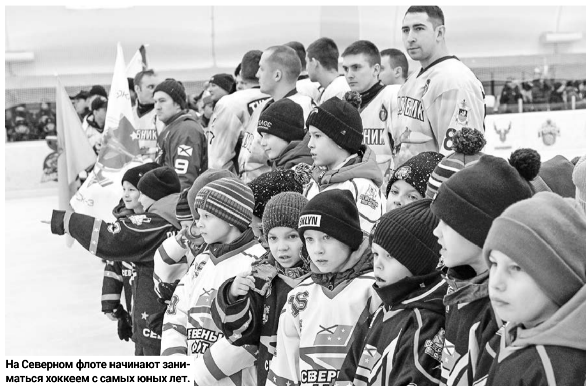
На Северном флоте начинают заниматься хоккеем с самых юных лет.

наши коллективы не примут участие в давно полюбившемся розыгрыше Ночной хоккейной лиги, которую именуют любительским чемпионатом страны. Команды СВХЛ — постоянные участники сочинских Финалов Фестиваля НХЛ. Впрочем, командующий пообещал через год постараться вернуться в Ночную лигу. В завершение присутствующие почтили минутой молчания погибших в ходе СВО.