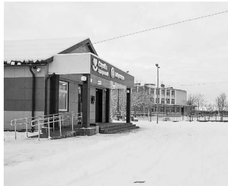
Территория вокруг амбулатории в Североморске-3 нуждается в благоустройстве.

Подведены итоги конкурсного отбора инициативных проектов жителей в рамках губернаторской программы «На Севере — твой проект» для реализации в 2024 году.