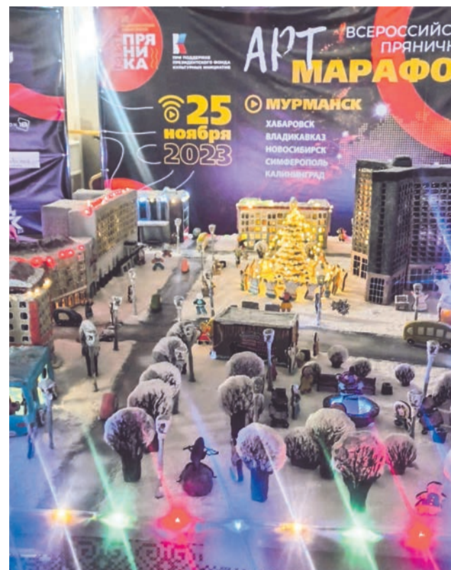
Пряник, изготовленный североморскими мастерами, весит 55 килограммов, а его размер составляет два с половиной метра.