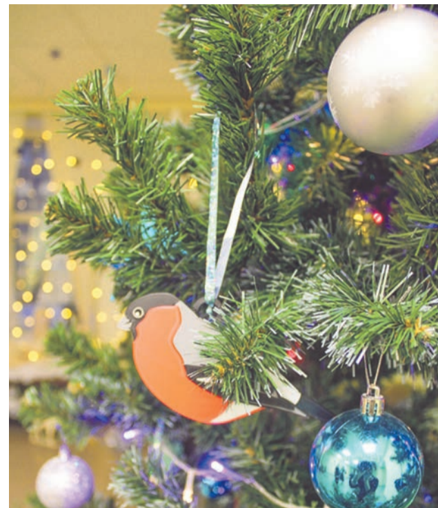
Снегирь - символ стойкости, целеустремлённости, надежды, дружбы и взаимовыручки.