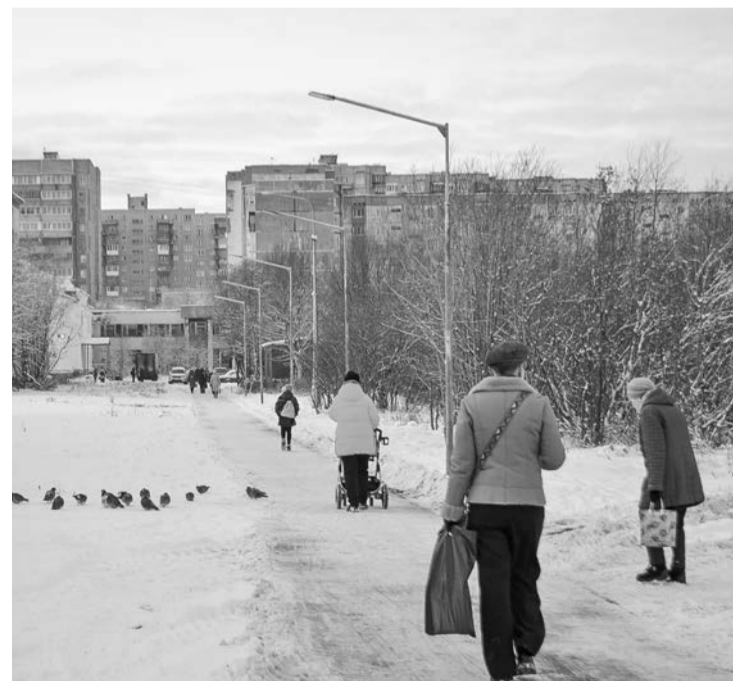
Тротуар на ул. Северной - проходное место, востребованное старшим поколением, школьниками, мамами с детскими колясками.