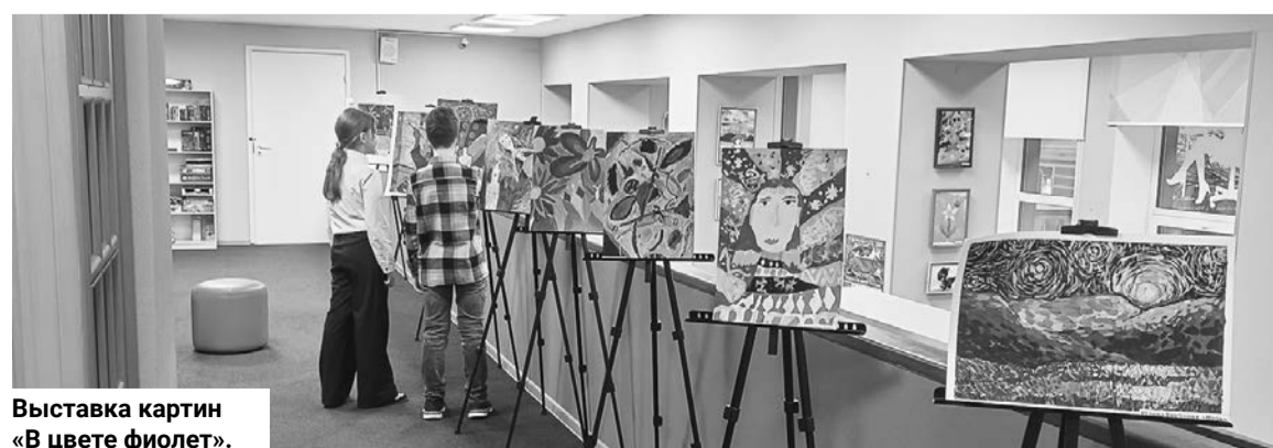
Выставка картин «В цвете фиолет».

ли мастер-класс по тестопластике «Сказочный дракон» и создали уникальную фигурку — символ наступающего 2024 года. А в арт-лаборатории ребята проявили свою фантазию и сделали яркий аксессуар из цветной бумаги — кошачьи ушки «Вайлет кэт».