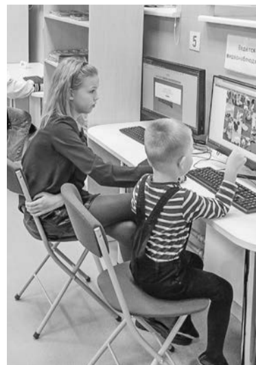
Онлайн-пазлы «Мультишный фиолетовый» пользовались успехом у посетителей.

Все, кто хотел попробовать свои силы в творчестве, посети-