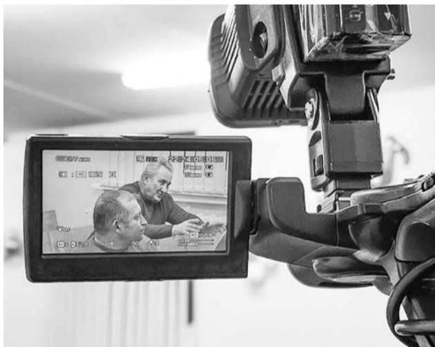
Запись видеотрансляции встречи главы ЗАТО с жителями Щукозера можно посмотреть в группе «ВК» Североморского телевизионного канала.

одна отапливает ул. Приозерную, другая — ул. Агеева, третья — воинские части. Моё мнение — нужно строить одну новую газовую котельную на всех потребителей. Кроме того, надо вести расчёт нагрузки и исходя из планируемого индивидуального жилищного строительства в посёлке.