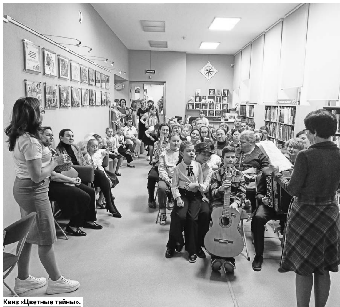
Квиз «Цветные тайны».