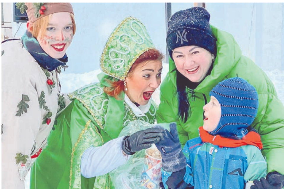
Фотографироваться со сказочными героями хотели и дети, и взрослые.