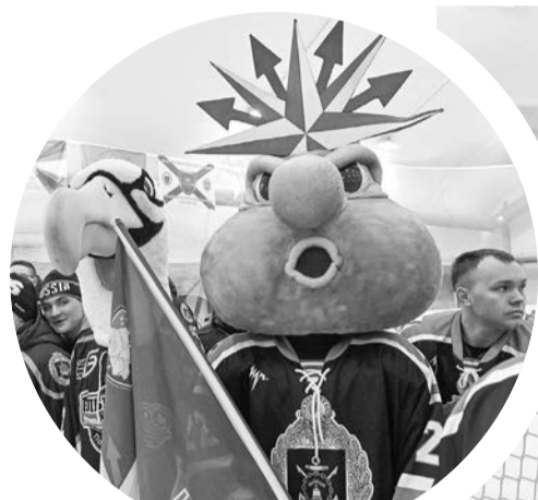
Нептун, бог морей, обещал помогать морякам из «Шквала».