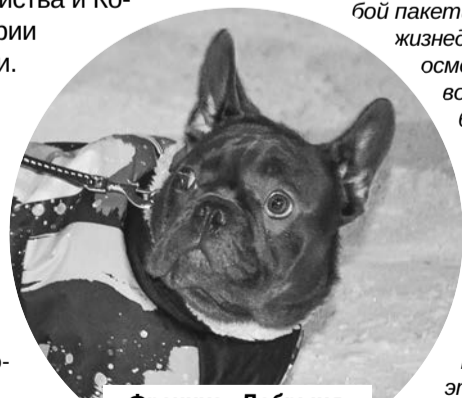
«Француз» Добрыня - пример хорошего поведения.