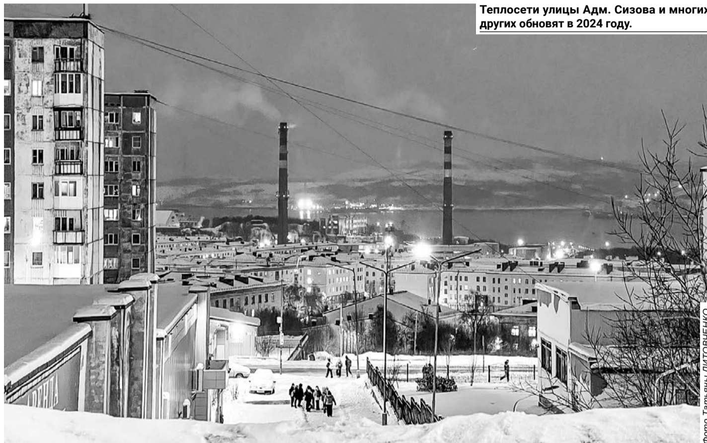
Теплосети улицы Адм. Сизова и многих других обновят в 2024 году.