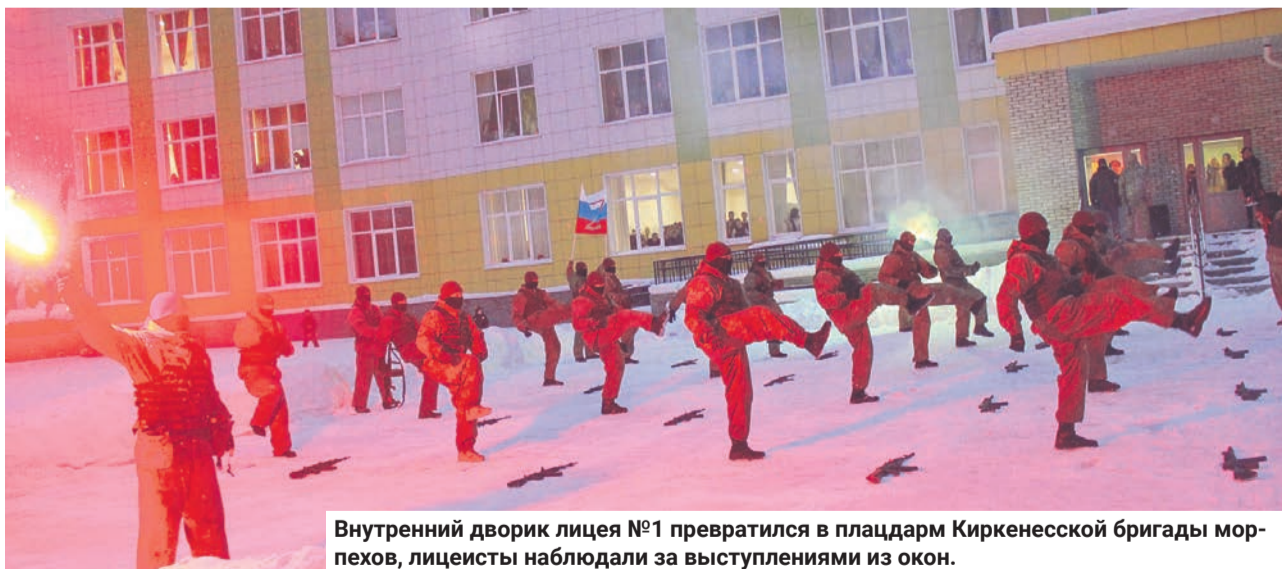
Внутренний дворик лицея №1 превратился в плацдарм Киркенесской бригады морпехов, лицеисты наблюдали за выступлениями из окон.

шли до норвежского Киркенеса и приняли участие в его освобождении. За успешное выполнение поставленных задач были награждены орденом Красного Знамени, в названии бригады (тогда — полка) появилось почётное наименование «Киркенесская».