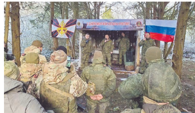
Артисты Ансамбля песни и пляски СФ дали концерт для морпехов Киркенесской бригады на передовой.

сом Боевого Знамени, прошли митинг и поминальная лития о погибших, были возложены венки и цветы.