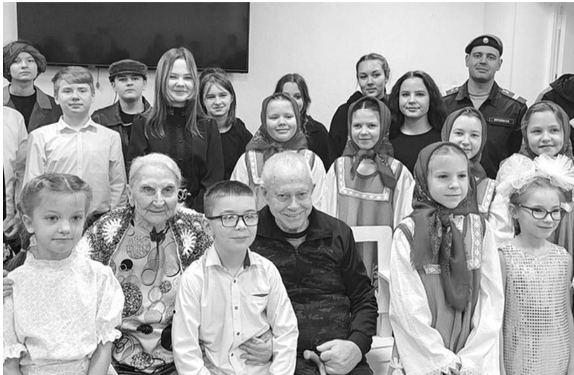
Юные артисты театра «Поиск» впервые выступали перед такими щедрыми на эмоции и искренними зрителями.

3 декабря отмечается Международный день инвалидов. Его основная цель — привлечь внимание общественности к проблемам людей с ограниченными возможностями здоровья.