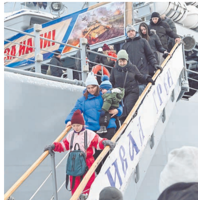
В грузовом трюме «Ивана Грена» демонстрируется подбитая в ходе СВО украинская бронетехника.

Завершился автопробег в посёлке Спутник, где состоялось построение с выно-