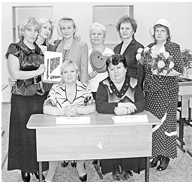
Школьный этап конкурса «Учитель года»: педагоги начальной школы получили «отлично».