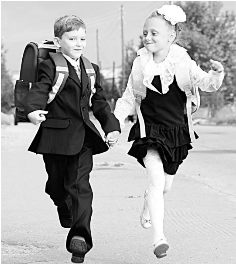
Школьный парадокс: чем младше ученик, тем больше и тяжелее его портфель.