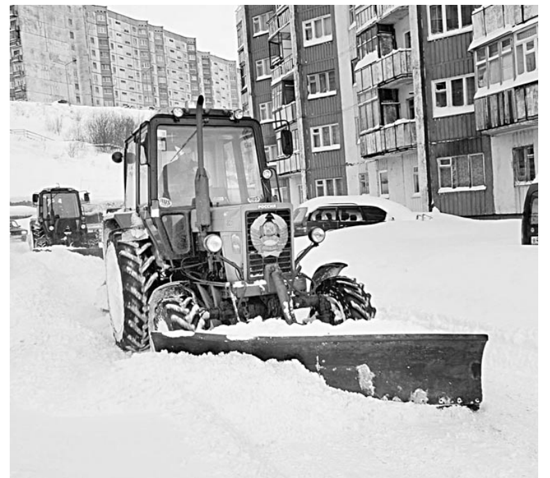
В прошлом году после сильного мартовского снегопада АДС вывез из города 700 тыс. кубометров снега.