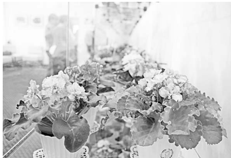
В такой оранжерее хочется заблудиться!

Нельзя забывать о том, что участницы «Сенполии», как и все обычные женщины, работают, у всех есть семьи, да и домашние дела никто не отменял. Но, тем не менее, у них каким-то невероятным образом получается уделять цветам внимание, время и силы. К тому же, выращивание фиалок – занятие не из деше-