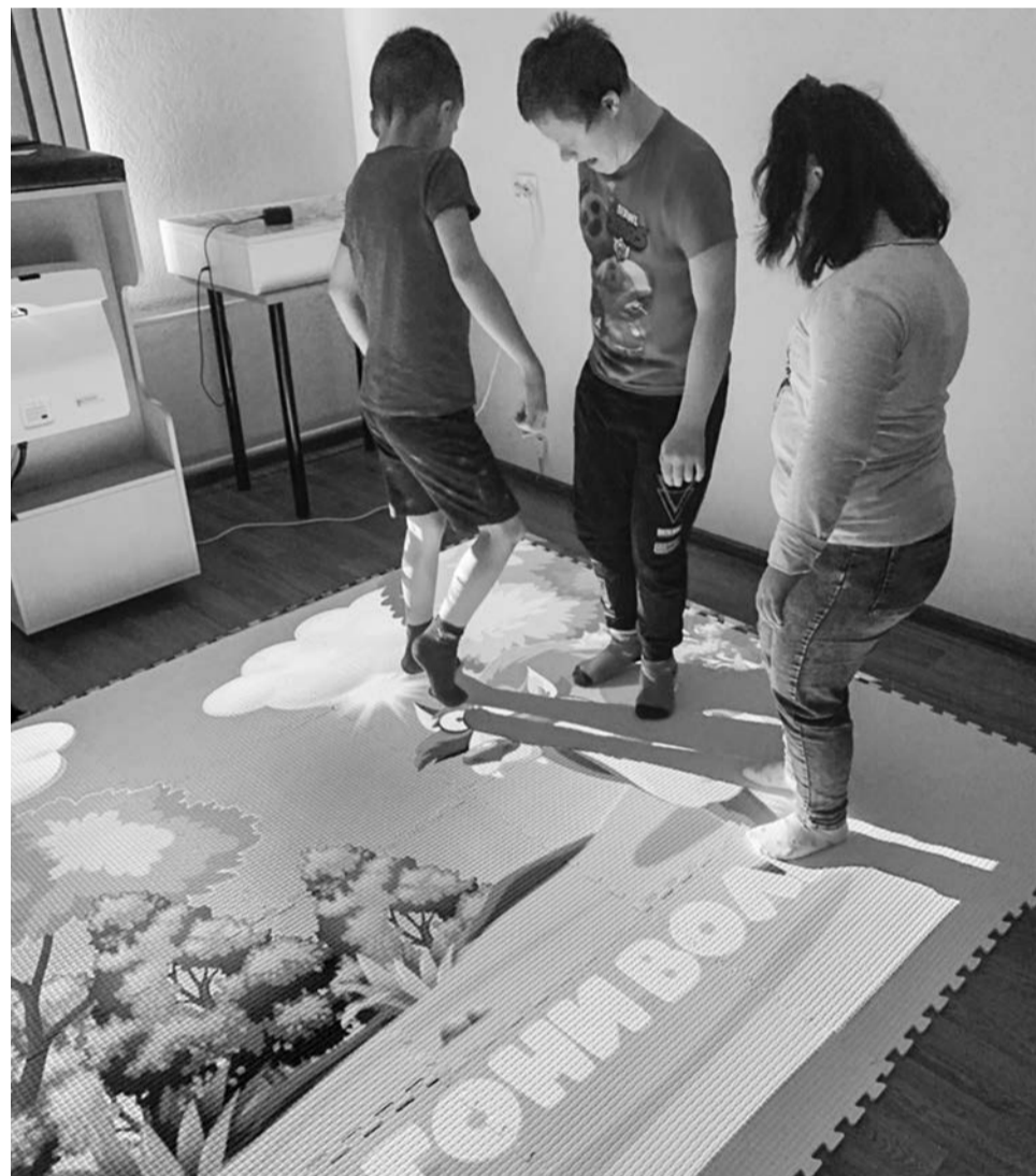
Интерес детей к интерактивному полу очевиден. Ведь здесь можно и встретить любимых персонажей мультфильмов, и попутешествовать, и заняться спортом.

Отделение социальной реабилитации детей-инвалидов КЦСОН ЗАТО Североморск.