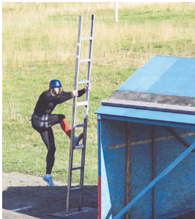
Одной из дисциплин соревнования была эстафета 4Х100, содержащая в себе некоторые элементы работы сотрудника МЧС.

Несмотря на соперничество между командами, атмосфера на соревнованиях оставалась дружной, тем