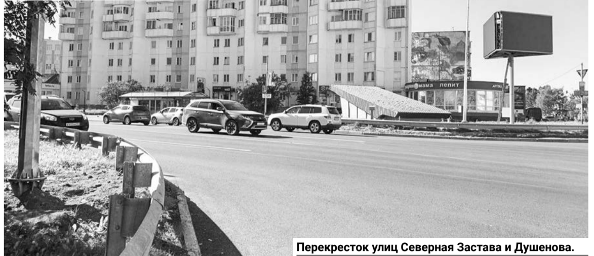
Перекресток улиц Северная Застава и Душенова.

Активно продолжается работа и на других улицах. Например, на улице Саши Ковалева (от ул. Душенова до ул. Сизова, 2) дорожное полотно полностью подготовлено под асфальтирование. Проезд важен для жителей, он ведет к школе № 7. На улице Комсомольская (от ул.