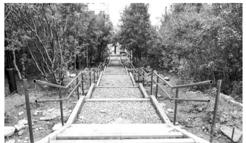
Трап, ведущий в сквер на ул. Гаджиева.