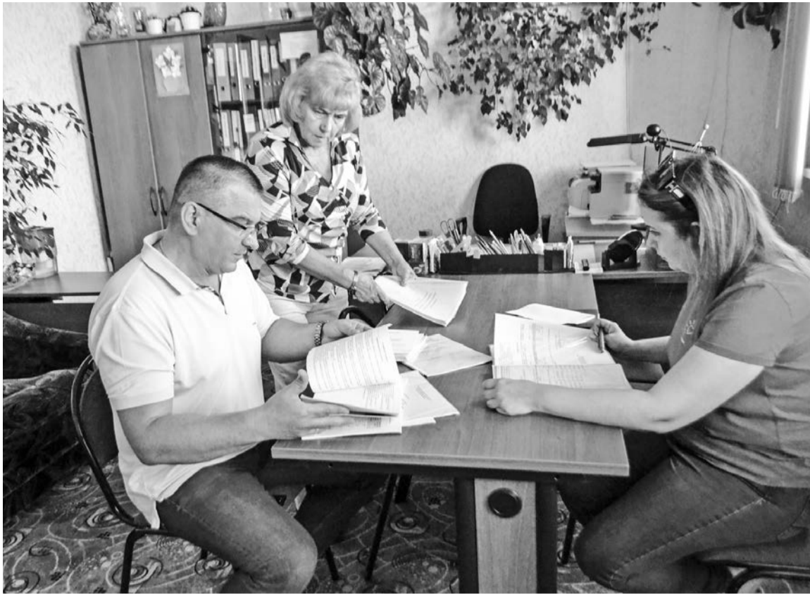
В ходе приемки члены комиссии внимательно подходят и к ведению всей документации в образовательном учреждении.

Отмечу, что наш детский сад посещают дети от 1 года до 7 лет, которые живут как в поселке Щукозеро, так и в Североморске. Малышей из флотской столицы организованно привозят на автобусе утром и увозят вечером. В дороге детей сопровождают наши сотруд-