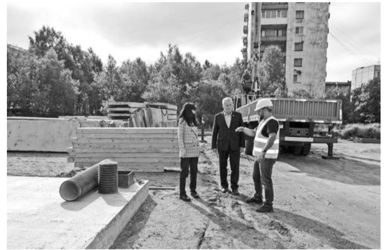
Жители поселка Сафоново с нетерпением ждут открытия хоккейного корта, который станет центром притяжения и детей, и взрослых.