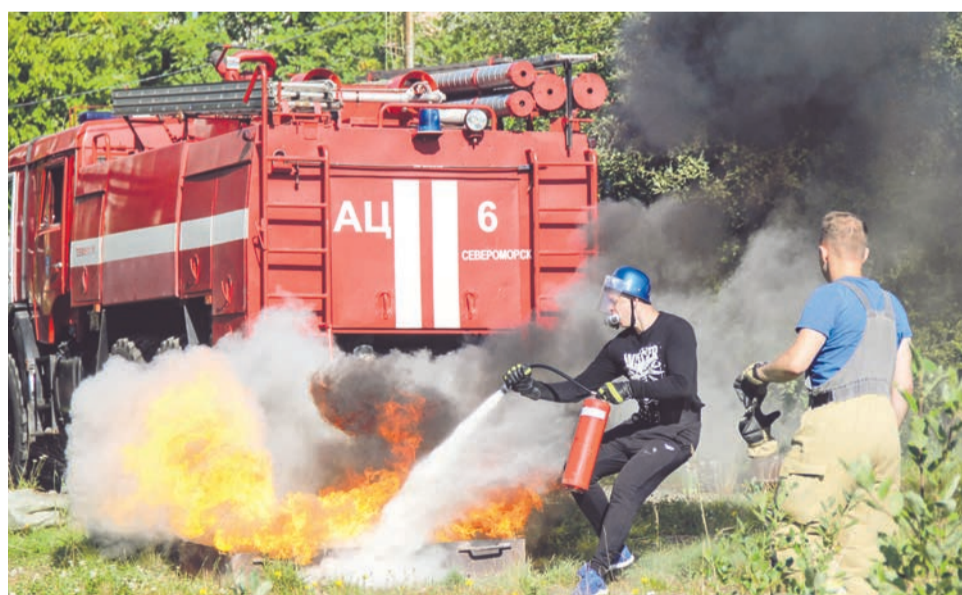
Судьи обращали внимание и на скорость участников, и на точность их действий.