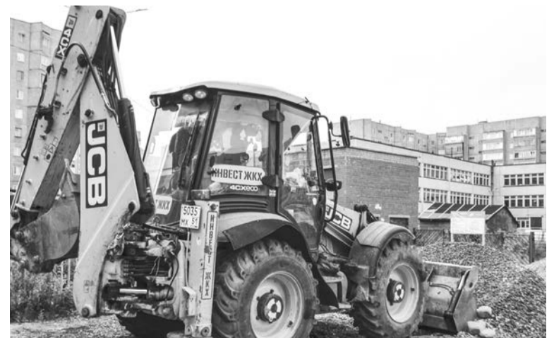
На улице Полярной, 4 вывозятся излишки щебня для использования на благоустройстве других объектов.