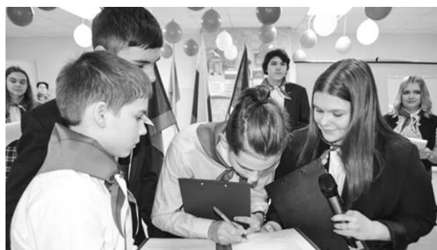
Вступление в ряды «Первых». Торжественная линейка в школе №10.

Всего за год работы региональным отделением молодежного движения Движение Первых, основанного по поручению Президента России Владимира Путина, создано 105 первичных организаций в муниципалитетах Мурманской области.