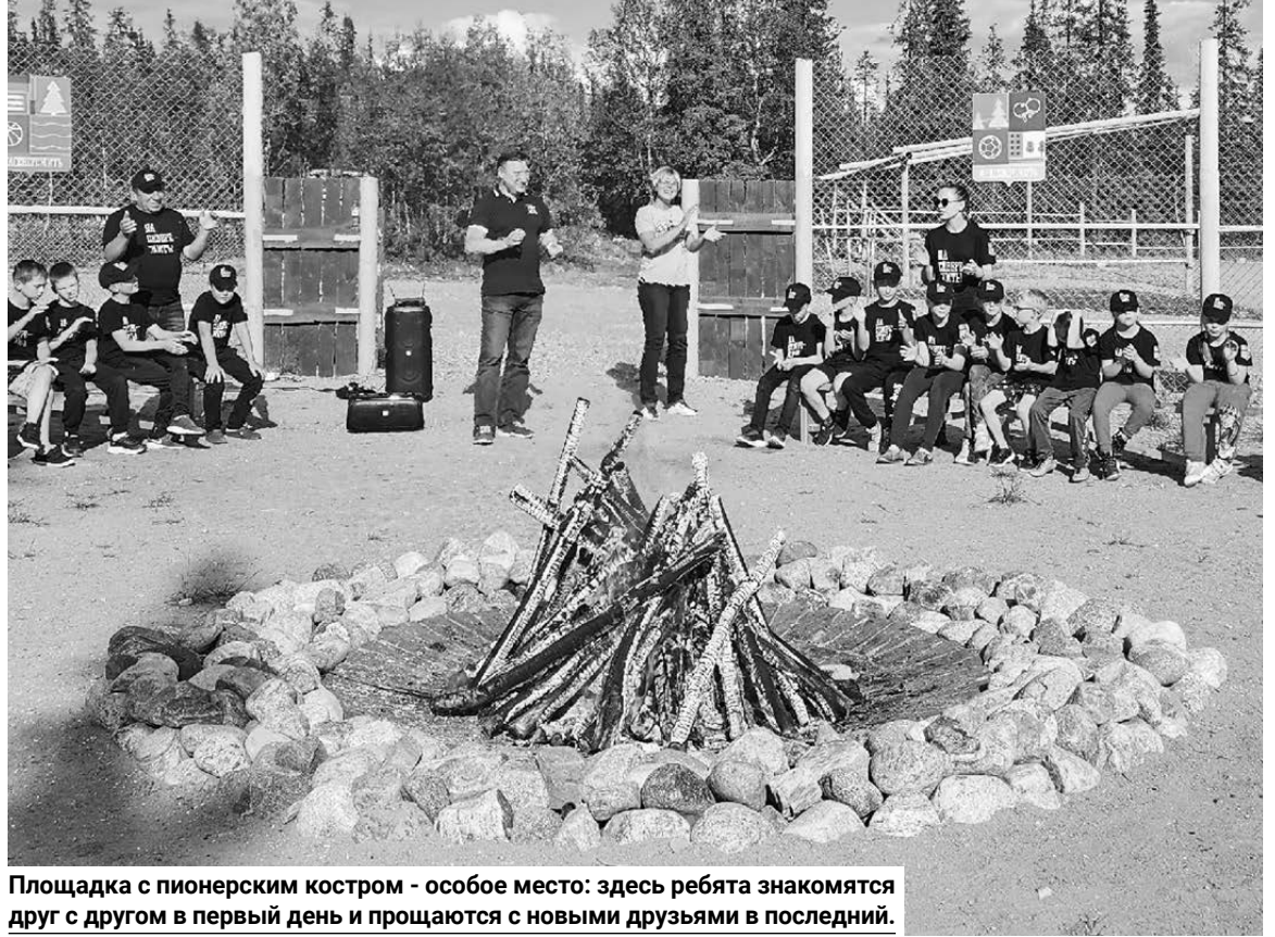
Площадка с пионерским костром - особое место: здесь ребята знакомятся друг с другом в первый день и прощаются с новыми друзьями в последний.

— Сейчас такие времена в нашей стране, что это просто необходимо делать. На каком-то этапе мы потеряли и детей, и молодежь. И сейчас пришло вре-