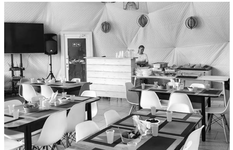
Питание детей организовано в кафе купольного типа – глемпинге. Для приготовления еды есть собственная кухня, а повара и обслуживающий персонал являются штатными сотрудниками Центра.

— Мне очень понравилось. Мы были на экскурсиях на атомном ледоколе «Ленин», кормили животных в «Легендах Севера», а еще увидели фабрику варенья. Здесь очень интересно и весело.