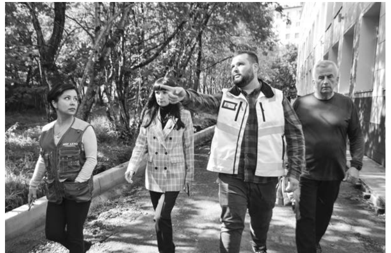
Сотрудники МБУ АХТО и руководство муниципалитета - частые гости на объектах ремонта.

Школы №1 и 2 — одни из старейших образовательных учреждений в ЗАТО, и такое масштабное преобразование переживают впервые. Ремонт и здесь идут полным ходом, основной перечень работ почти такой же, как и в школе №12. Директора и учителя во всех трех школах на месте, такое сотрудничество с подрядчиками помогает сделать