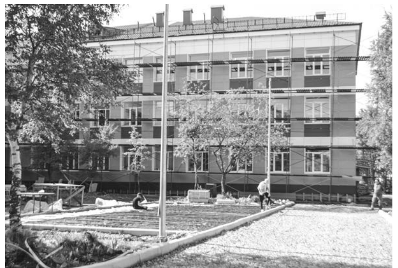
В школе №1 работы во внутренних помещениях и обустройство территории вокруг учреждения идут параллельно.

школы уютнее, комфортнее и для учебы, и для работы.