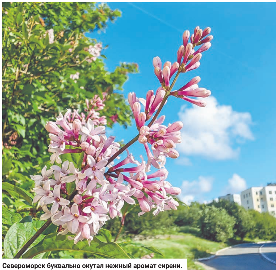
Североморск буквально окутал нежный аромат сирени.