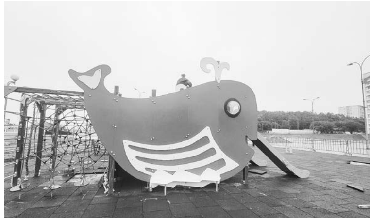
С новыми игровыми элементами детская площадка на Приморской заметно преобразилась.

Благодаря поддержке регионального правительства обновилась