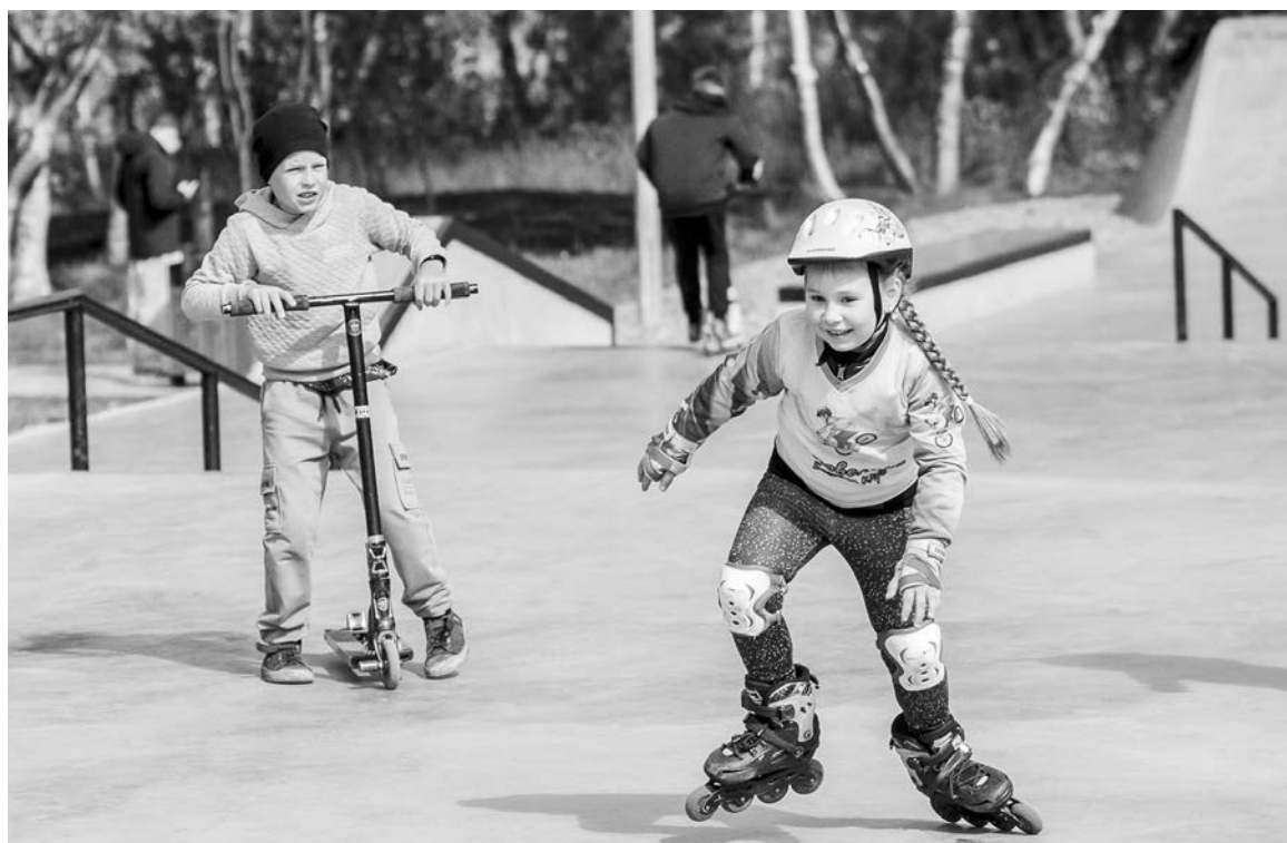
Юным североморцам новый скейт-парк пришелся по душе: поклонники экстремальных видов спорта с удовольствием проводят здесь свое свободное время.

Глава региона также подчеркнул, что помимо масштабных ремонтных работ в школах и детских садах флотской столицы обновляются пространства в рамках программы «Арктическая школа», открываются образовательные площадки для подготовки к олимпиадам, а также для проведения научно-исследовательской деятельности.