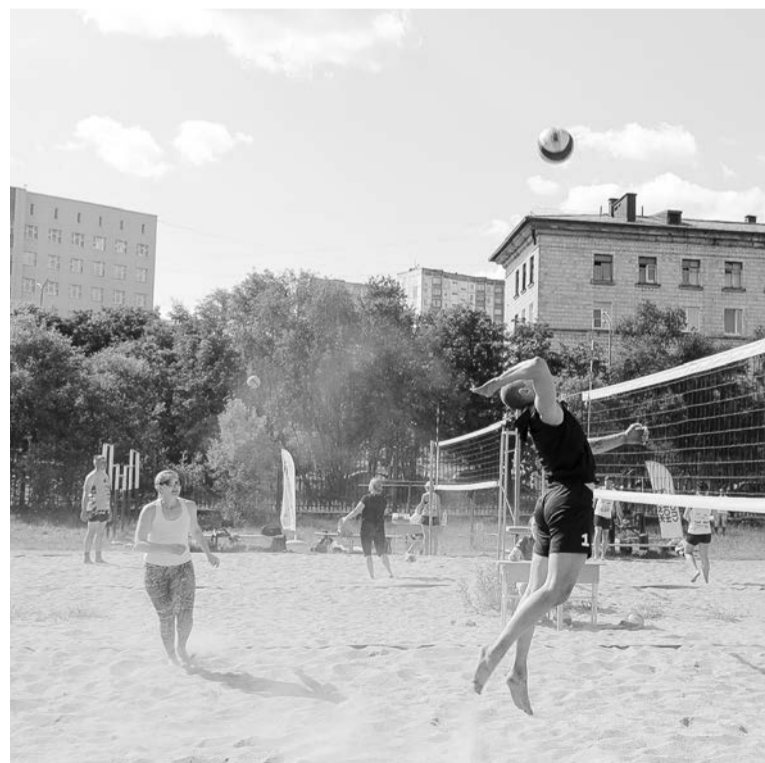
В атаке победители соревнований - команда «Огонь».

проигравший сразу не выбывал из игры, а отправлялся в нижнюю, более длинную часть сетки, где получал второй шанс.