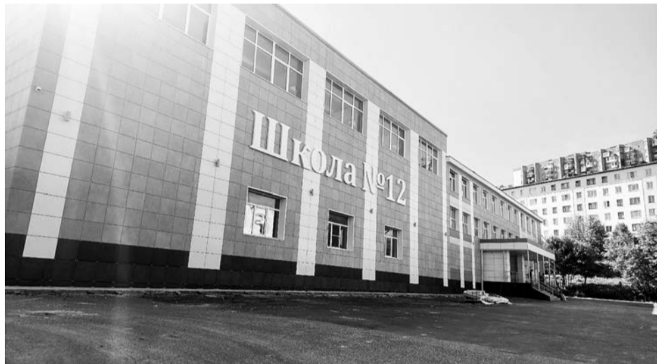
Ремонт школы №12 на финишной прямой: подрядчик активно работает над чистовой отделкой внутренних помещений.

— Капитальный ремонт школы остается на постоянном контроле. Сроки сжатье,