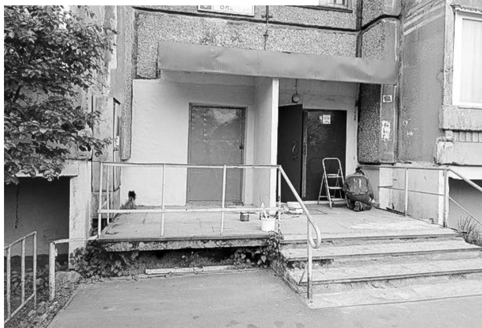
Одно из приоритетных направлений работы управляющих компаний в летний период — ремонт входных групп. На ул. Полярной, 9, подъезды уже обновились.

Для управляющих компаний лето — горячая пора. Подготовка к предстоящему осенне-зимнему периоду, плановый текущий ремонт многоквартирных домов, благоустройство придомовых территорий, покосы травы — каждодневные будничные обязанности.