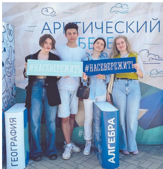
Фото на память: выпускники лица №1 на фестивале «Арктический берег».