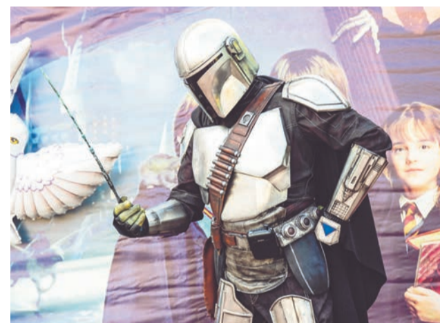
Специальный гость Дня молодежи в Североморске — мандалорец Дин Джарин.