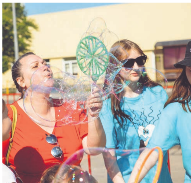
Мыльные пузыри всегда вызывают радость, улыбку и смех, как у детей, так и у взрослых.