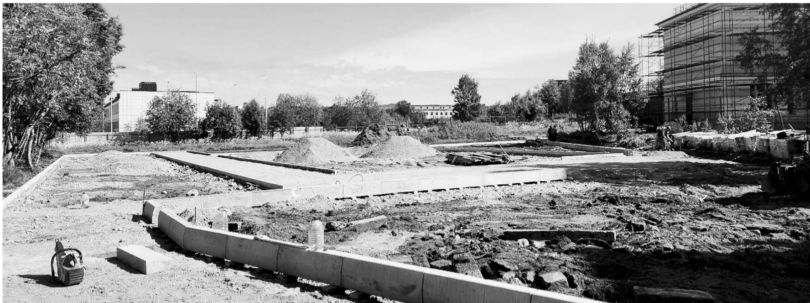
Территория школы №1 уже заметно преобразилась: видны очертания беговой дорожки и футбольного поля. Уроки физкультуры на свежем воздухе в новом учебном году ребятам явно понравятся.

В школе №1 в активной фазе работы по благоустройству территории. К новому учебному году здесь появится не только новое