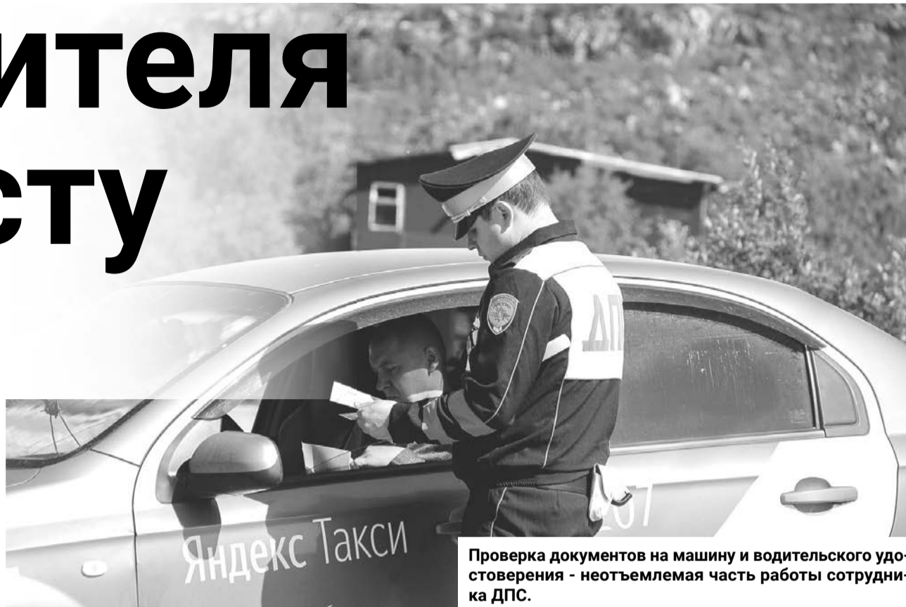
Проверка документов на машину и водительского удостоверения - неотъемлемая часть работы сотрудника ДПС.

— Чаще всего нарушают правила молодые люди от 20 до 30 лет. После 30-ти ездят уже более степенно. Женщины, конечно, более осторожны