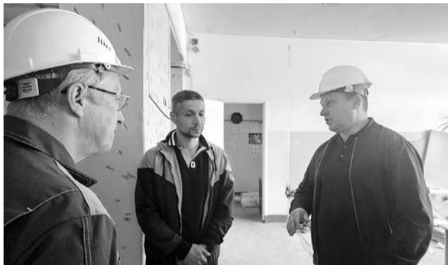
Прямой диалог с подрядчиками позволяет решать возникающие вопросы в максимально короткие сроки.

асфальтобетонное покрытие, но и будут обустроены беговые дорожки, небольшое футбольное поле и площадка для воркаута. Также активно ведутся работы по замене окон, установке вентилируемого фасада и ремонт внутренних помещений. Кроме того, за счет муниципальных средств к новому учебному