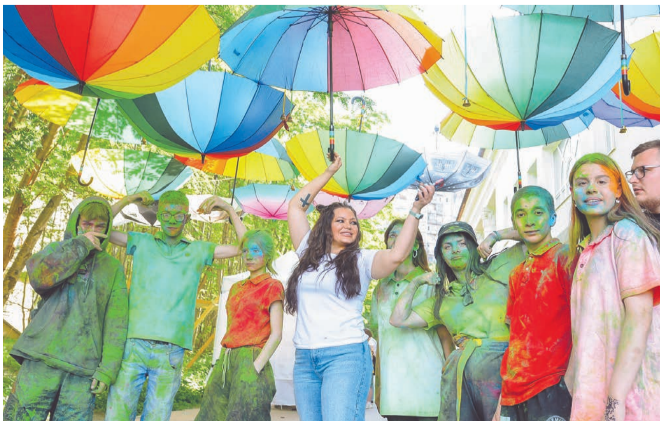
Отличная погода и молодежный задор сделали праздник незабываемым.