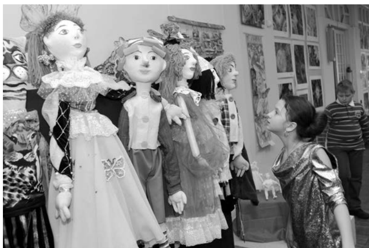
Кто бы думал, что в музее есть столь необычная коллекция кукол и марионеток...

Рассказ, предваряющий мастер-класс по изготовлению венецианской маски, раскрыл тайны и историю знаменитого карнава-