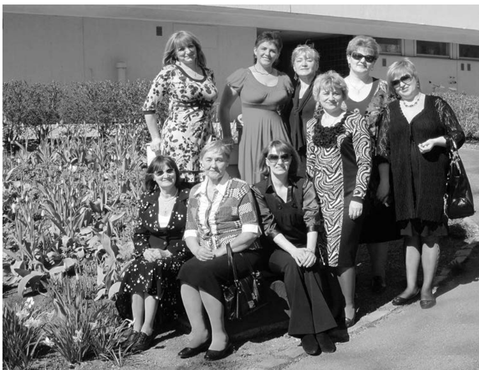
В Турку североморские артисты успели и на сцене выступить, и достопримечательности увидеть, и насладиться теплыми майскими днями.

- Мы выбрали песню «Береза», посвященную празднику Великой Побе-