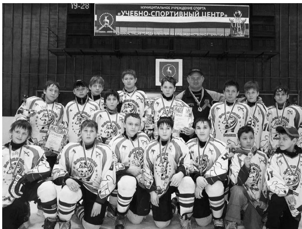
Североморцы остались довольны результатами закрытия сезона. В каждом соревновании команда брала призовые места.

В эти же дни в Ледовом Дворце спорта в Кондопоге проходил турнир памяти заслуженного мастера спорта Евгения Мишакова - двукратного олимпийского чемпиона, чемпиона мира и Европы, восьмикратного чемпиона СССР. В соревнованиях выступили 5 команд спортсменов